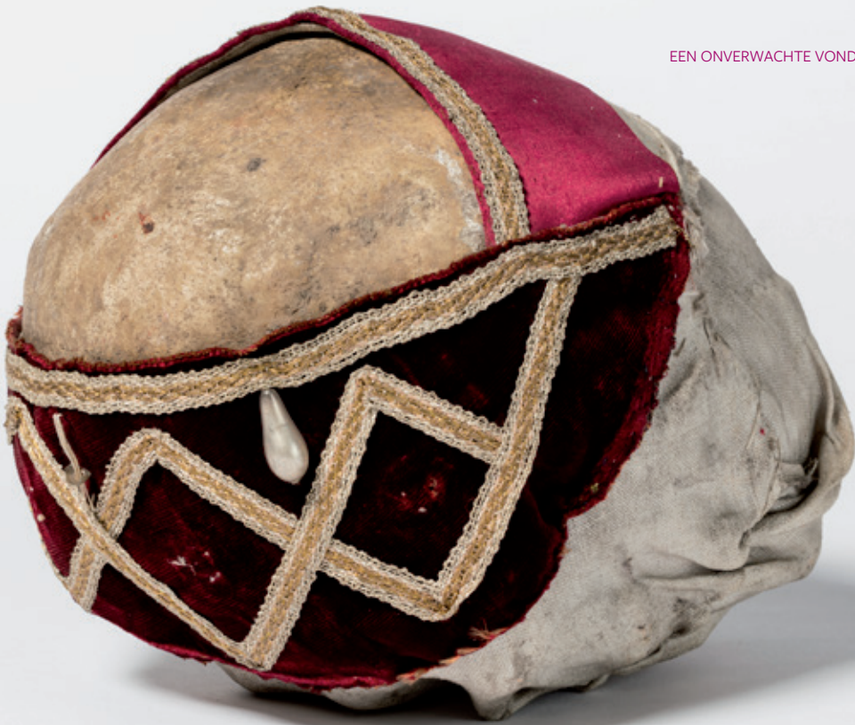
Afb. 8 Schedelrelik in het reliekschrijn. Borgloon, Sint-Odulphuskerk.