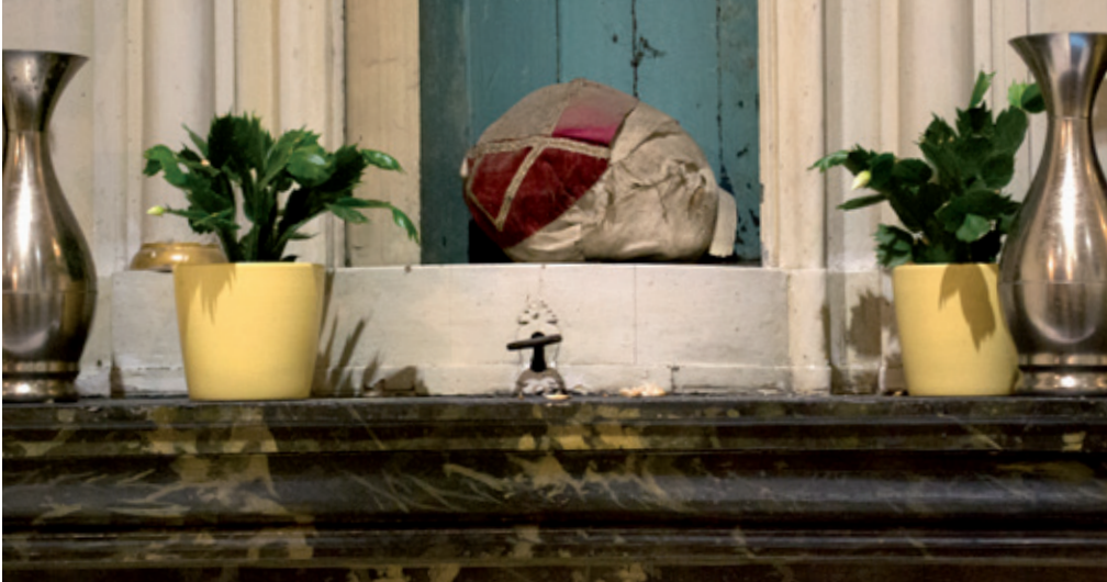
Afb. 4 Opname net na de vondst van de schedel in het altaar.