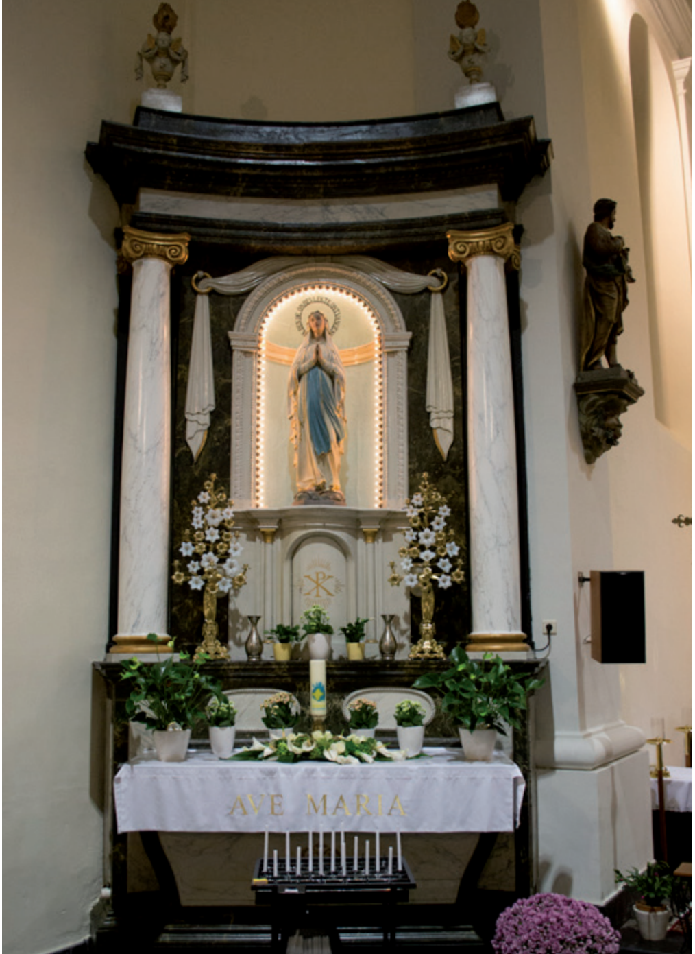
Afb. 3 Maria-altaar. Kerniel, Sint-Pantaleonkerk.