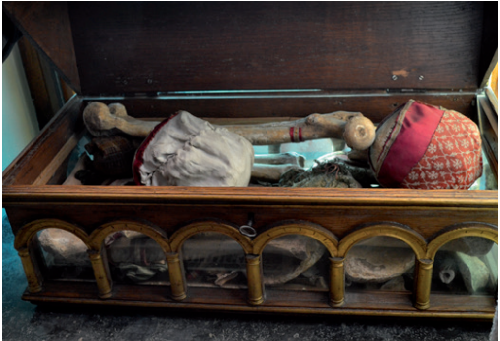
Afb. 7 Reliekschrijn gevuld met textiel, schedels en beenderen, 17de eeuw (?). Borgloon, Sint-Odulphuskerk.

opgeborgen, die werd toegeschreven aan Sint Ursula. 29 Een doos met daarin een schedel maakt ook deel uit van de collectie van Museum De Mindere in Sint-Truiden. 30