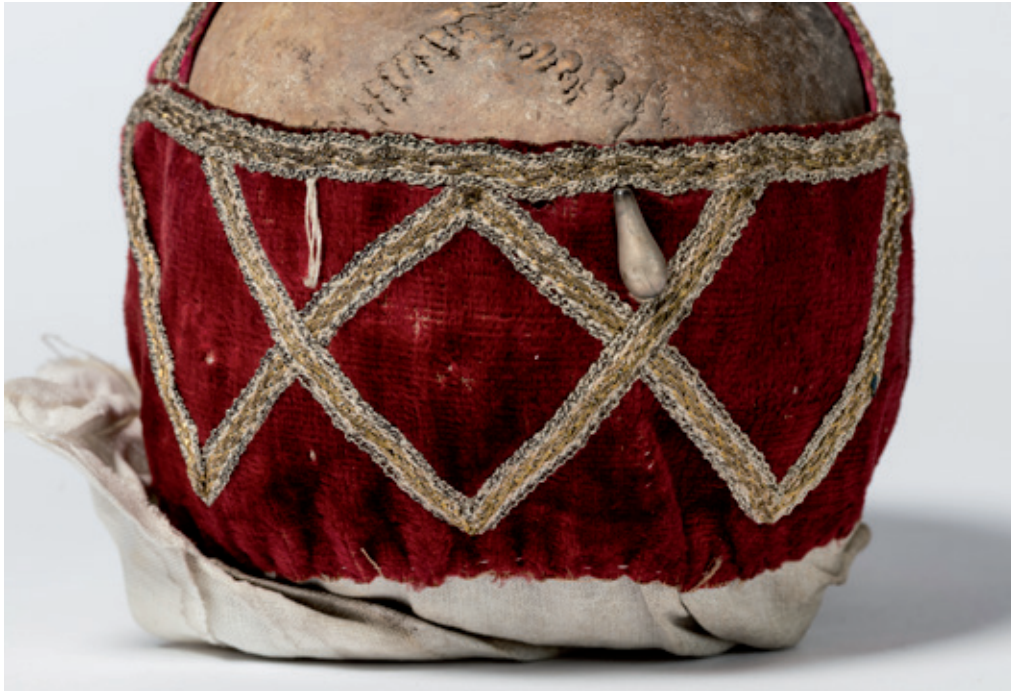
Afb. 9a ▲ en 9b ▼ Detail fluweel met metalen decoratieband van de schedel van Kerniel (a) en Borgloon (b).