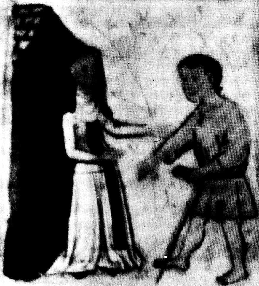
Pl. 14. Une sœur hospitalière accueille un pauvre , Règle des sœurs de l'hôpital Notre-Dame de Tournai, Tournai, Bibliothèque de la Ville, Cod. 1A (conservé n° 24), fol. 2. IRR.