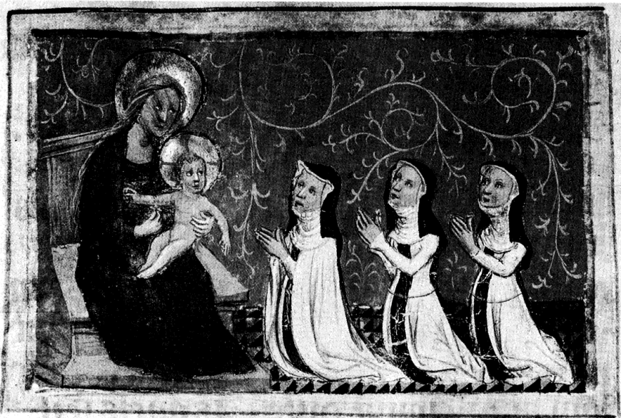
Pl. 11. a. Trois religieuses vénérant la Vierge à l'Enfant , Règle des soeurs de l'hôpital Notre-Dame de Tournai, Tournai, Archives du Chapitre cathédral, Fonds des hôpitaux, ms. IV 1/01, fol. 1. b. Trois religieuses vénérant la Vierge à l'Enfant , Règle des soeurs de l'hôpital Notre-Dame de Tournai, Tournai, Bibliothèque de la Ville, Cod. 1A (conservé n° 24), fol. 1.