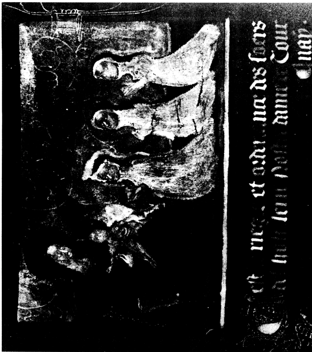
Pl. 12. Trois religieuses vénérant la Vierge à l'Enfant, radiographie de 11b.