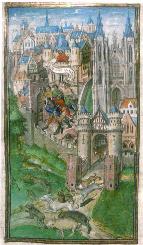
Figuur 2: Mithridates, koning van Pontus en Armenië, laat de Romeinen afslachten; in Rome worden de huisdieren opnieuw wild en verlaten ze de stad.

chez un grand prélat bourguignon, Jean Chevrot', in F. JOUBERT (ed.), L'Artiste et le Clerc. La commande artistique des grands ecclésiastiques à la fin du Moyen Âge (XIV e -XVI e siècles) , Paris, 2006, p. 41-103, spec. p. 51 ( Cultures et civilisations médiévales , 36) • A. VAN BUREN, J. MARROW & S. PETTENATI, Heures de Turin-Milan, Inv. n° 47. Museo Civico d'Arte Antica, Torino. Commentaire , Luzern, 1996, p. 527-528.