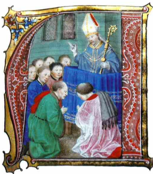
Figuur 2: een bisschop predikt (detail). Brussel, KBR, Handschriftenkabinet, hs. 9215, f. 125r.

een bisschop die predikt (fig. 2). De uiterst verzorgde compositie is kenmerkend voor de stijl van Simon Marmion. We hebben hier onbetwistbaar te maken met het werk van een groot schilder. De compositie valt op door de verbazend fijne uitvoering en een zin voor realistische details die zeldzaam is in de boekverluchting. De penseelvoering is heel tactiel en het modelé, uitgevoerd door toevoeging van microscopische streepjes, verleent aan de miniatuur een perfecte afwerking. Volledig bevrijd van het keurslijf van de oude modellen, die nog een grote invloed uitoefenden op de composities van de 'Tweede meester van de Grandes Chroniques ', ontwikkelde Marmion een homogene en moderne visie van de ruimte waarin de personages heel natuurlijk bewegen. Kenmerkend voor deze schilder is zijn duidelijke voorkeur voor transparante stoffen, hier goed zichtbaar in het koorhemd van de in gebed geknielde kanunnik. Het herinnert aan het hemd van de prelaat die de H. Hiëronymus voorstelt in het paneel van Philadelphia (Philadelphia Museum of Art), aan dat van de acoliet van Guillaume Fillastre in het Sint-Bertijnsaltaarstuk (Berlin,