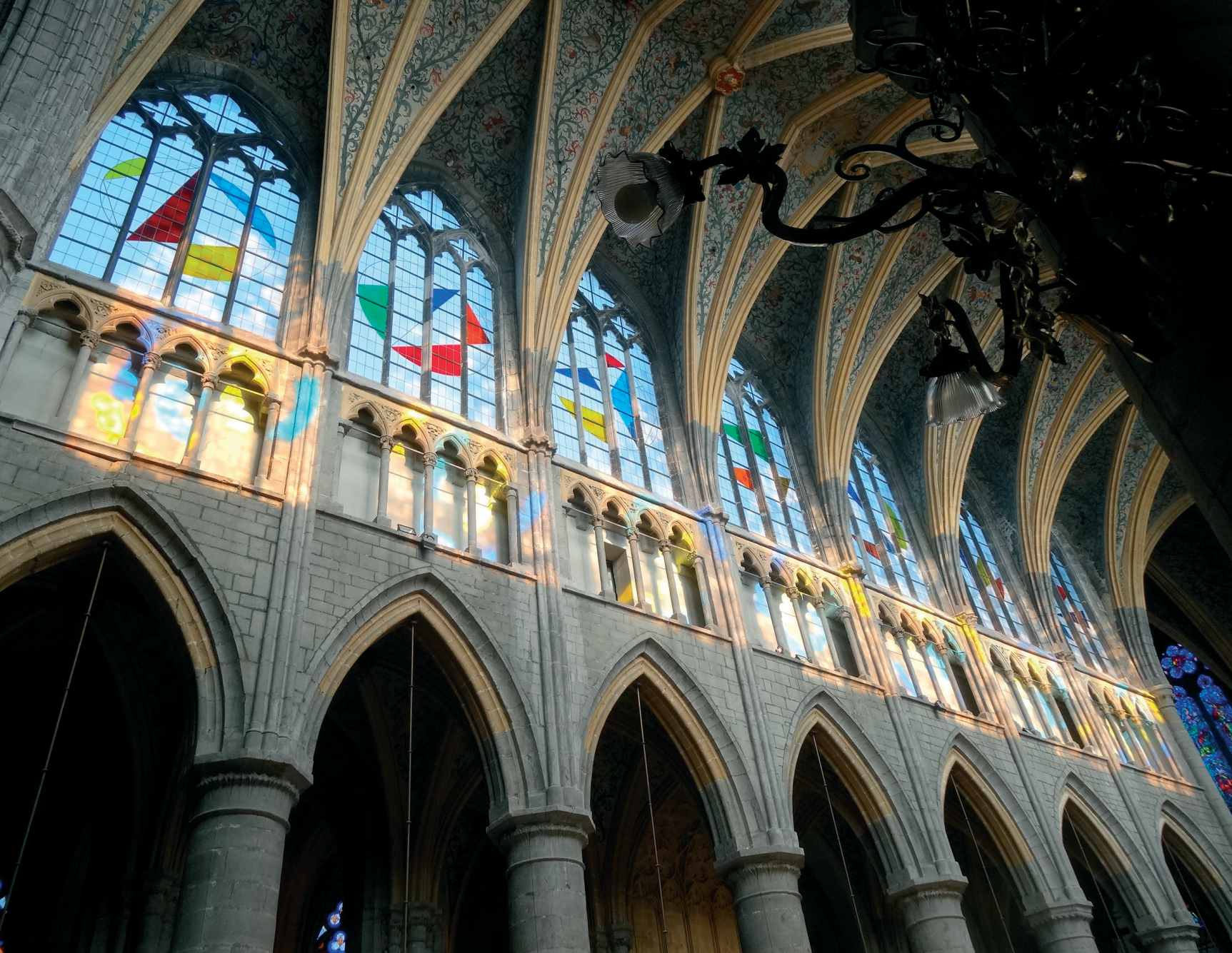
❖ fig. 3 Fenêtres du vaisseau central, côté nord. © Architectes associés s.a, Sprimont.

menées parallèlement : l'opération « puzzle », avec la mise en vente de 100 puzzles du vitrail au prix unitaire de 1.000 euros et l'opération « signets Mécènes », à 10 euros pièce, pour permettre à chacun de participer selon ses moyens.