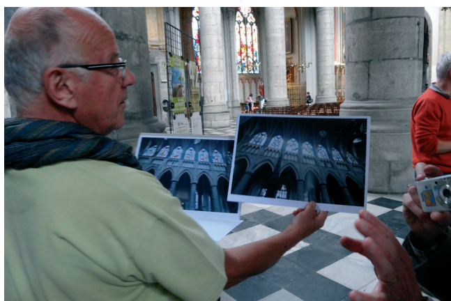
fig. 1 Examen d'une simulation des vitraux du vaisseau central placés dans les fenêtres.