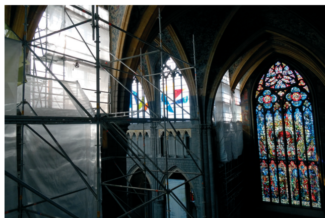
fig. 2 Échafaudages dans le transept.

Dans l'intervalle, Michel Teheux et sa sœur Marie-Bernadette Teheux accomplirent un autre geste de mécénat, inattendu et inespéré, qui allait permettre à la cathédrale de retrouver une parure vitrée presque complète : la prise en charge du financement de la conservation-restauration du vitrail de Léon d'Oultres, déposé par l'atelier Pirotte en 1999-2000, et en caisses depuis lors. Cette initiative soutenait les démarches entreprises par la fabrique d'église, dès l'inauguration des vitraux de la première phase, pour récolter des fonds afin de mettre en œuvre le programme de restauration de ce chef d'œuvre. Un fond spécial fut dédié à cette cause par la Fondation Roi Baudouin pour recueillir les dons. Deux autres opérations furent