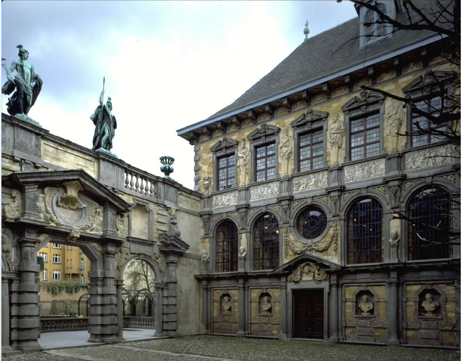
La casa de Rubens, en Amberes