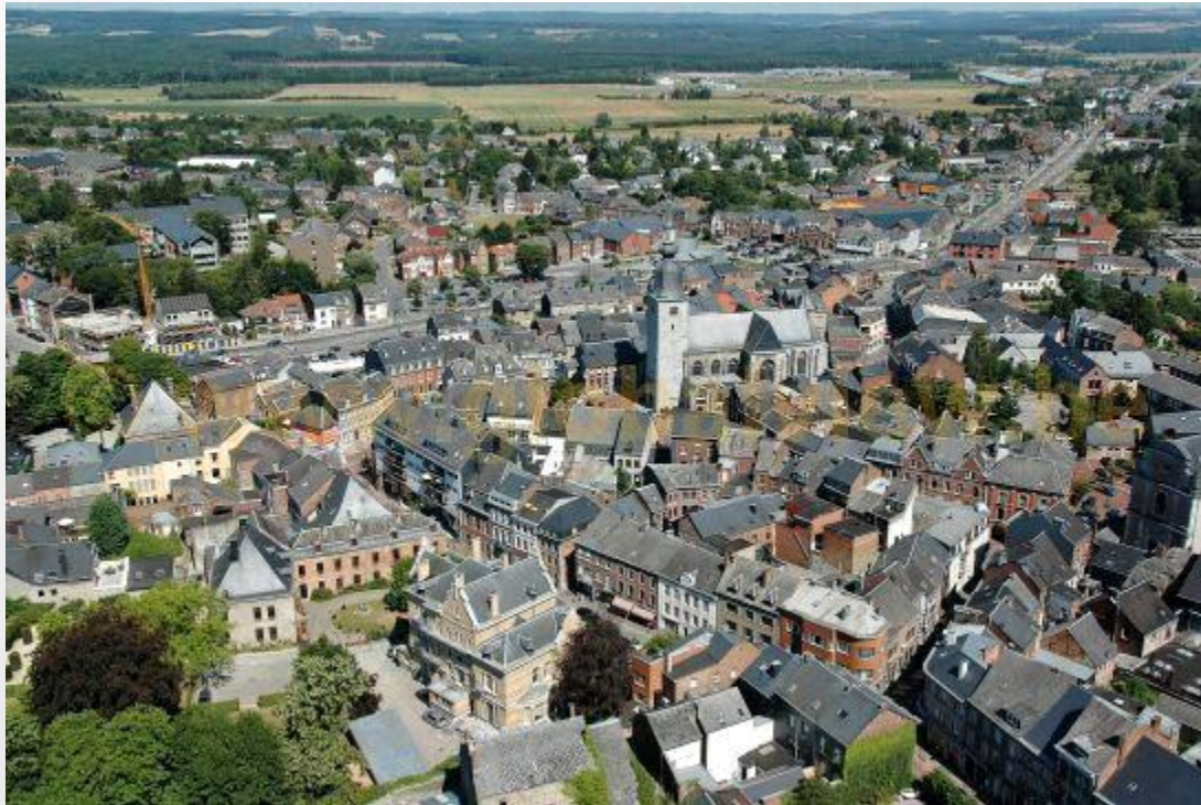
Marche-en-Famenne, provincia de Luxemburgo