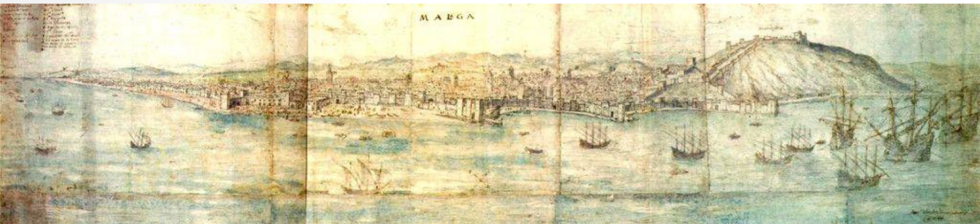
Anton van den Wyngaerd (Amberes, ca. 1525-Madrid, 1571), Vista de Málaga en 1564