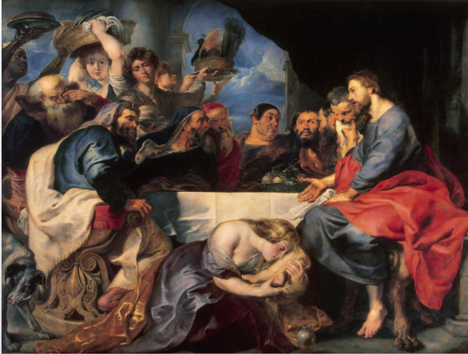
P. P. Rubens y asistentes, Convite en casa de Simón , San Petersburgo, Hermitage