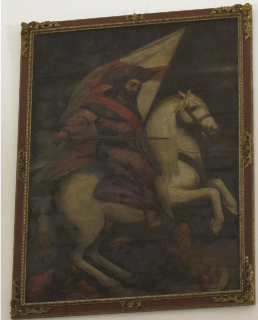
Miguel Manrique (?), Santiago Matamoros , Málaga, iglesia de Santiago