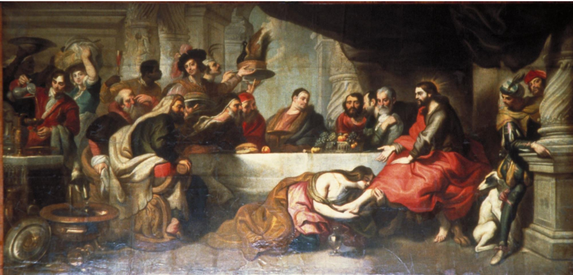
Miguel Manrique, Convite en casa de Simón , Málaga, catedral