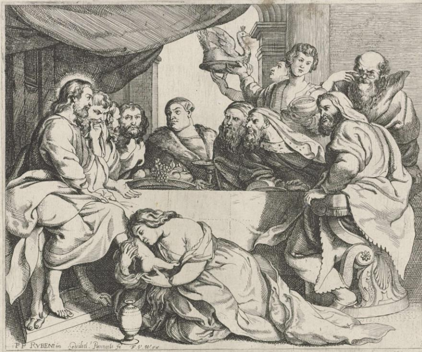
Willem Paneels según Rubens, Convite en casa de Simón