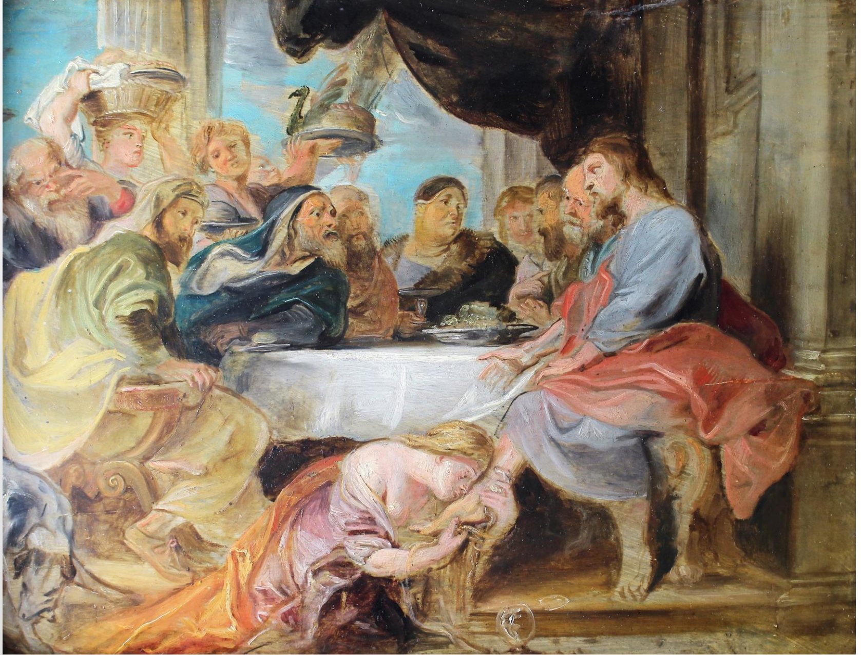
P. P. Rubens, Convite en casa de Simón , Viena, Academia de B.B.A.A.