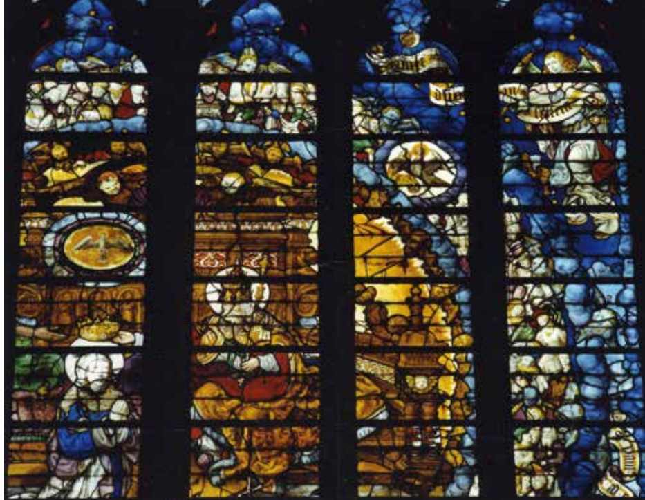
Figure 4. Liège. Cathédrale Saint-Paul. Vitrail du bras sud du transept, offert par Léon d'Oultres en 1530. Détail du Couronnement de la Vierge.

Les vitraux anciens de la cathédrale avaient été déposés pendant la Seconde Guerre mondiale. On s'en félicite : tous les vitraux des XIX e et XX e siècles restés en place ont été détruits le 12 janvier 1945 par l'explosion d'une bombe volante. Le vitrail de Léon d'Oultres est le seul vitrail ancien à avoir été déposé depuis. L'étude préalable à la restauration a été achevée en 2001. La restauration va enfin être entreprise, grâce au support de généreux donateurs et aux soutiens de la Fondation Roi Baudouin et de la fabrique d'église. Le traitement de conservation-restauration consistera au placement d'un vitrage de protection qui soustraira le vitrail aux agressions extérieures, au nettoyage de chacune des nombreuses pièces de verre des 287 panneaux du vitrail (plus de 6300 pièces au total), à la réparation des casses et à la consolidation des panneaux. Cette intervention, souhaitée depuis longtemps, complétera celles qui ont été effectuées récemment sur d'autres vitraux anciens liégeois : la conservation-restauration des vitraux du chœur de la basilique Saint-Martin (1987-2012) et le renouvellement de