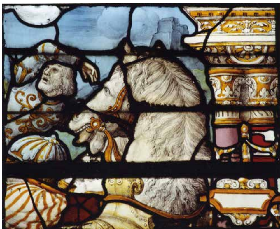
Figure 3. Liège. Cathédrale Saint-Paul. Vitrail du bras sud du transept, offert par Léon d'Oultres en 1530. Détail de la Conversion de Paul de Tarse sur le chemin de Damas.

La datation de l'ensemble du vitrail à 1530 est généralement admise. Par contre, Henri Hamal (1744-1820) déclarait en 1786, dans ses « Notices » : de deux côtés la Sainte Trini-