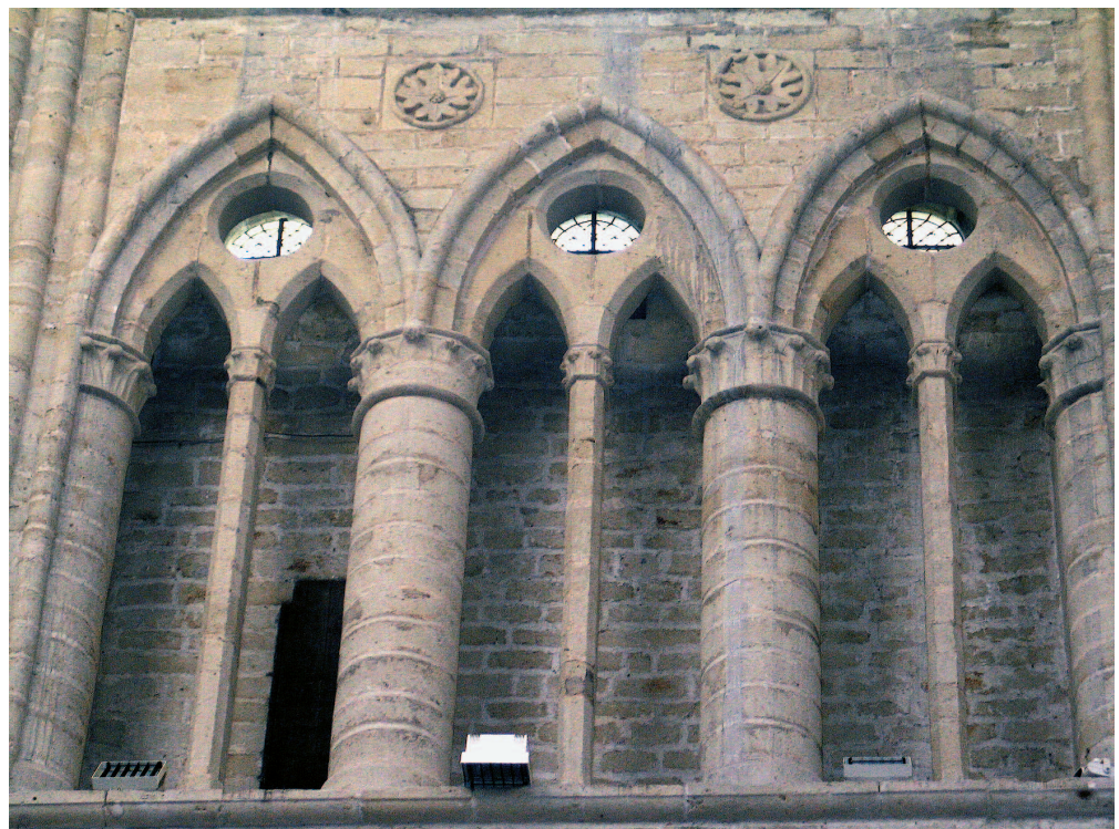
11. Travée du chœur avec les oculi apparents. Travee van het koor met de zichtbare oculi.