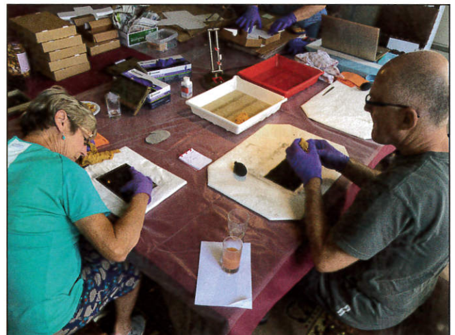
Conservatiebehandeling van de glasplaten met behulp van een museumstofzuiger, scalpel, blaaspeer, antistatische doekjes en gedistilleerd water met reinigingsproduct.