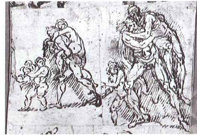
Fig. 7. Esquisses et scènes sur quatre registres (détail), Lambert Lombard, Liège, Cabinet des Estampes et des Dessins, Album d'Arenberg (N.9a), s.d.