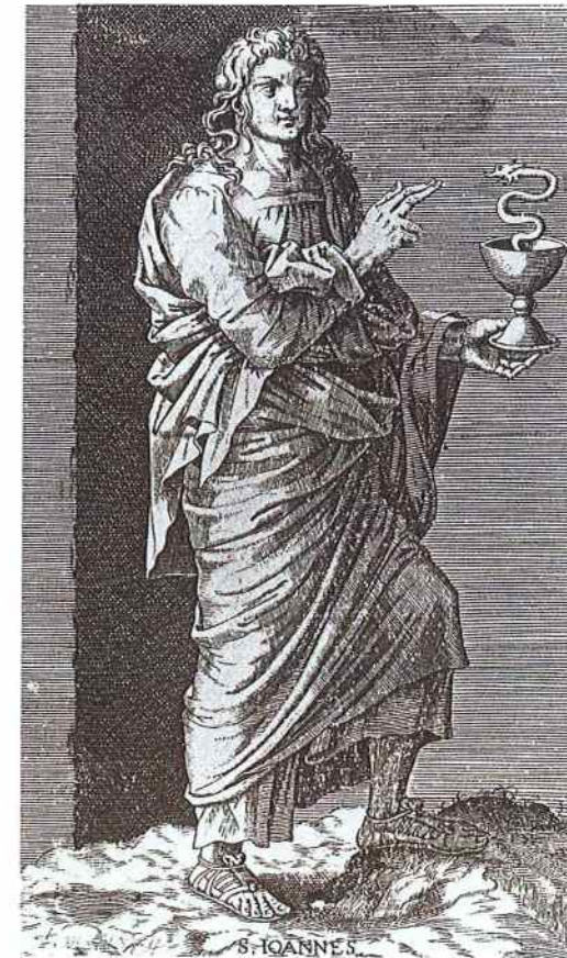
Fig. 3. Saint Jean , gravure de la suite du Christ et des Apôtres, par Lambert Suavius d'après Lambert Lombard. D'après G. DENHAENE, Lambert Lombard , op. cit. , fig. 103, p. 90.