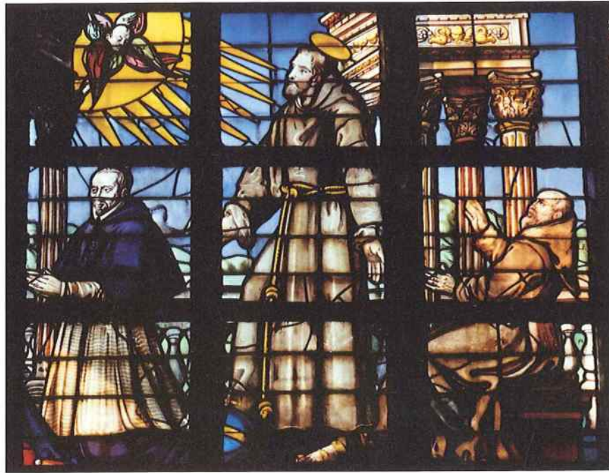
Fig. 4. Mons, collégiale Sainte-Waudru, détail du vitrail de François Buisseret, 1615.