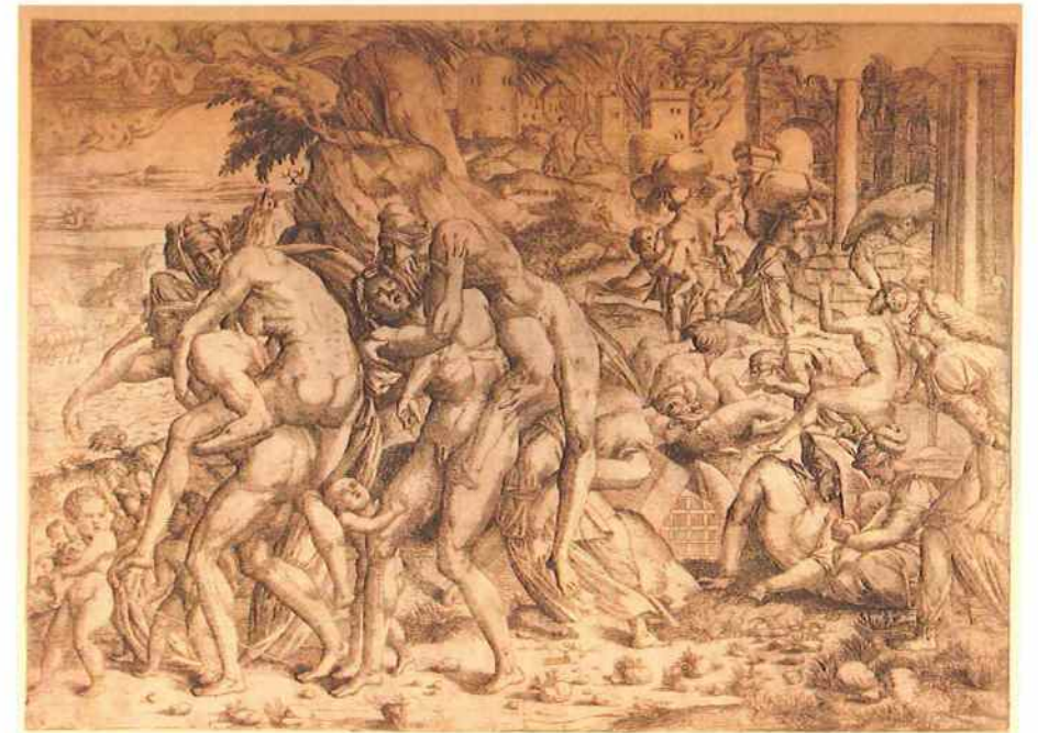
Fig. 8. Les jumeaux de Catane emportent leurs parents sur leurs épaules tandis que l'Etna ravage la ville, gravure d'après Rosso Fiorentino et attribuée au monogramme « IQV ».