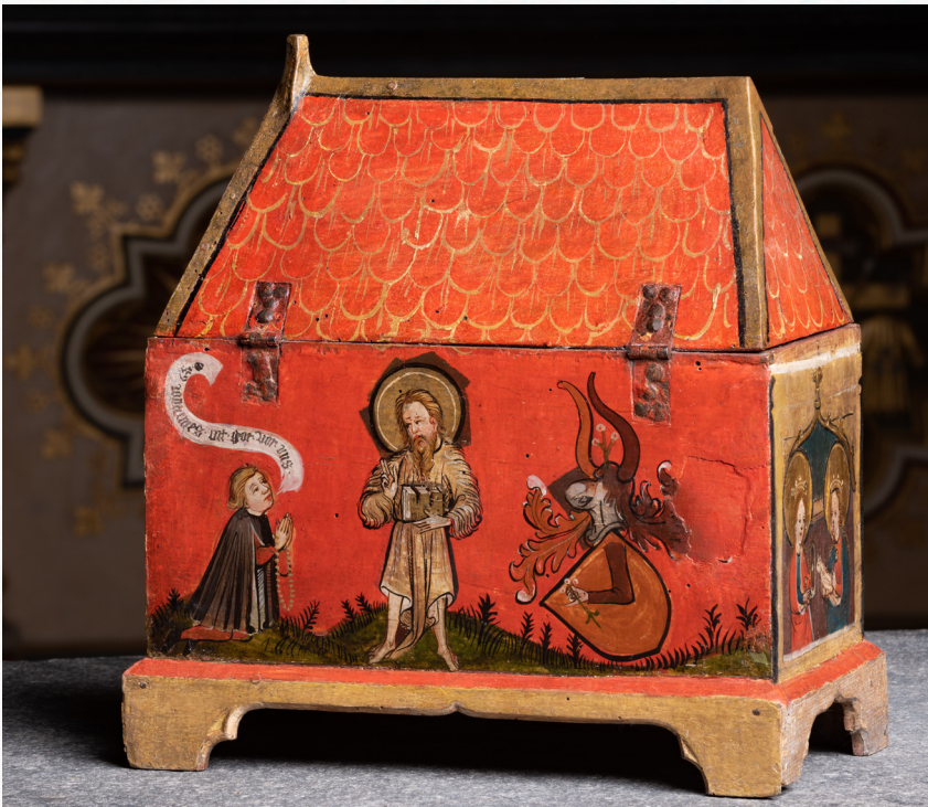
[AFB.3] Beschilderd relikschrijn van Johannes de Doper uit ca. 1490.