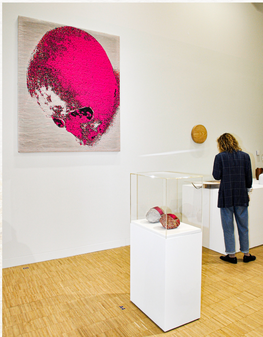
[AFB.2] Twee schedelreliken op de tentoonstelling 'In Absence' in Hasselt.

Een gedachtewisseling tussen rouwen en objecten werd dit jaar voorgesteld op de tentoonstelling 'In Absence' (20 april-11 mei) die Sereni samen met PXL-MAD School of Arts in Hasselt realiseerde. Hedendaagse kunstenaars kregen er de kans om hun rouwkunstwerken te tonen. Eveneens werd aandacht geschonken aan het verleden, waarbij er twee schedels en een eeuwenoude reliekhouders aan het publiek werden gepresenteerd. [AFB.2] Door de tentoonstelling werd goed duidelijk dat we bij ieder rouwproces herinneringen en tactiele voorwerpen van een dierbare koesteren en dat we ons leven, ondanks het verlies, moeten verderzetten. Onze geliefden staan we af door het lichaam uit te strooien of in een columbarium te plaatsen of alles onder de grond te begraven. Bij de relieken liggen de kaarten opvallend anders. De stoffelijke resten van heiligen werden de voorbije eeuwen bewust niet weggestopt, met de bedoeling ze regelmatig te tonen. Zo kon de bijzondere aanwezigheid en kracht van de heilige op die plek geaccentueerd worden en versterkte het ook de verwondering bij de gelovigen.