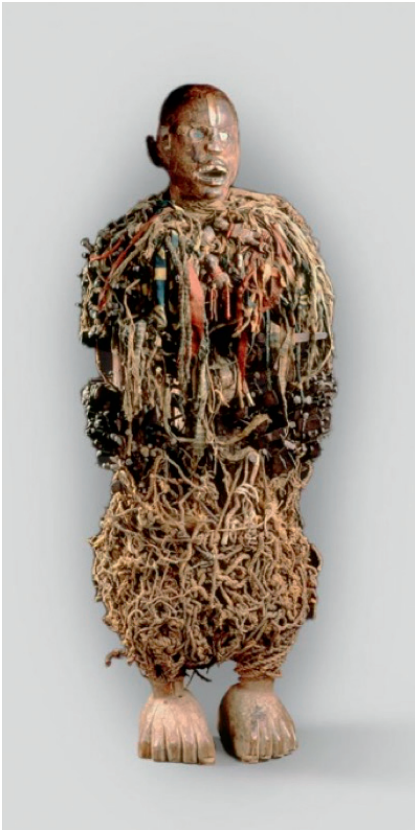
Afb. 3: Nkisi Nkondi Statue., inv. no. EO.o.o.7943.

de bezoeker overwegend passief toeschouwen. Het perspectief van ‘de ander’ wordt in de marge ingevuld door kunstwerken van de hand van Congolezen. Een statische en beschrijvende opstelling van objecten wordt ingehaald door het maatschappelijk debat over de verhalen achter de voorwerpen. Maarten Coutteniers herkomstonderzoek bracht de vernietigende context waarin het Nkisi-beeld werd toegeëigend door één van de pioniers van Congo-Vrijstaat, de Belgische officier Delcommune aan het licht. Het beeld werd tot driemaal toe teruggevraagd door de Congolese staat. 88 Ondanks het feit dat de immense collecties getuigen van een materiële impact van de kolonie op België en Congo, blijft de omstreden herkomst van de koloniale verzameling afwezig in de vernieuwde tentoonstelling. De kelder geeft deels mee hoe het verzamelen en beheren van de collecties historisch vorm kreeg. De meest controversiële beelden van de hand van de Belgische beeldhouwer Arsène Matton, waaronder de beroemde “Luipaardman”, werden bijeen geplaatst in een afzonderlijke ruimte. Matton maakte ze in 1911 in opdracht van het museum om een blik op de barbaarse aard van het antropologisch subject aan de museumbezoekers