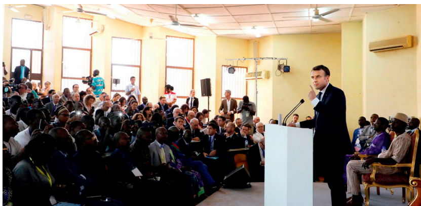
Afb. 1: Emmanuel Macron spreekt aan Universiteit van Ouagadougou op 28 november 2017.

Het restitutedebat over koloniale collecties in Europese wereldmusea kwam recentelijk in meerdere West-Europese landen op de voorgrond te staan. Kort na zijn benoeming in 2017 beloofde de Franse president Emmanuel Macron de restitutie van Afrikaanse objecten uit Frankrijk. In het voorjaar van 2018 nodigde de Duitse bondskanselier in aanwezigheid van de directie van het Humboldt Forum president Macron uit. Op 29 augustus 2018 resulteerde dit in de repatriëring van menselijke resten naar Namibië, gepaard gaande met eisen voor herstel en verontschuldigingen in Berlijn. 12 Kortom, Emmanuel Macrons speech op 28 november 2017 in de panafrikaanse aula van de universiteit van Ouagadougou bracht de Europese erfgoedgemeenschap in beweging ten voordele van restitutie. Macron sprak zich uit over de noodzaak aan teruggave van Afrikaans cultuurbezit om de economische band tussen Europa en Afrika in alle gelijkwaardigheid te herstellen: “De revolutie waardoor de jeugd zich omhoog kan tillen, is die van innovatie, en daarmee van ondernemerschap. Dit is de enige revolutie die de 450 miljoen banen kan opleveren die Afrika nodig zal hebben tegen 2050 (...). Verder stelde Macron hoe “het beste eerbetoon (...) niet alleen aan deze kunstenaars (...), maar ook aan die Afrikanen of Europeanen die hebben gevochten om deze werken te redden, alles doen om deze werken terug te doen keren.” 13 De Franse president brak het westers