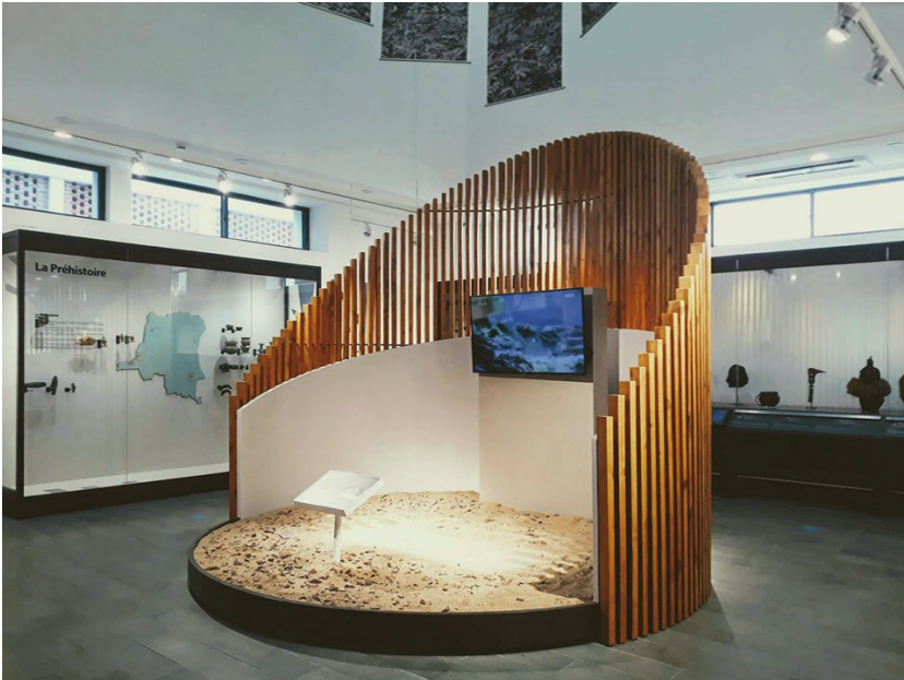
Afb. 5: Zaal in het nieuw museumgebouw in Kinshasa in Congo op 6 september 2019.

praktijken, samenwerkingen en/of debatten werden, ondanks opkomende dekolonisatiebewegingen en het huidige restitutedebat, tot nu toe door het forum onthaald of voortgebracht. 90