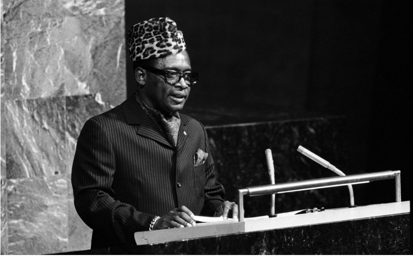
Afb. 2: Speech President Mobutu Seseko voor de Algemene Raad van de Verenigde Naties op 4 oktober 1971.

York. 16 Deze resolutie verklaarde hoe de volledige verwijdering van Afrikaanse culturele objecten in de context van de kolonisatie de ontwikkeling van een eigen nationale cultuur onmogelijk maakte en hoe de directe teruggave van deze objecten in het teken van herstel en internationale coöperatie stond. 17 Ondanks een provocatieve speech voor de algemene vergadering van de VN tegen het ongebonden en non-retroactieve karakter van de UNESCO-conventie van 1970, werd weinig gehoor gegeven aan de eisen van Mobutu Sese Seko. Volgens Sarah Van Beurden is één van de argumenten hiervoor het universele principe van de Werelderfgoedconventie van 1972, waarin alle werelderfgoedsites werden gezien als erfgoed van de mensheid. 18 Het gevolg was dat claims op culturele goederen in een nationale context irrelevant werden. 19 Bovendien zou het universeel karakter van objecten juridische acties tussen staten tegen illegale kunsthandel tenietdoen. 20 Een groeiend besef dat de UNESCO-conventie zich toespitste op de specifieke routes van koloniaal cultuurbezit suggereerde opnieuw een morele plicht en verantwoordelijkheid in het rechtmatig verdelen van cultuurbezit. In 1995 werd de complementaire