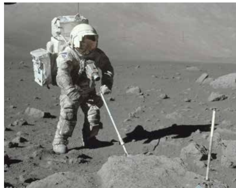
L'astronaute d'Apollo 17 Harrison Schmitt prélevant un échantillon de sol, sa combinaison spatiale recouverte de poussière. Image NASA AS17-145-22157.

La présence de ces particules chargées, semblables à des poussières, sur la Lune - mais aussi sur Mars, les comètes et les astéroïdes - constitue un véritable défi pour les futures missions d'exploration (habitées ou robotisées) des corps du système solaire. En plus de compromettre la santé de l'astronaute par l'irritation et l'inhalation de la poussière lunaire, celle-ci a de nombreux autres effets dangereux (instrumentaux). Pour n'en citer que quelques-uns : déchirure de la combinaison spatiale, obscurcissement de la vision extérieure, fausses lectures d'instruments, accumulation de poussière et contamination par celle-ci, perte d'adhérence, encrassement des mécanismes, abrasion, problèmes de contrôle thermique (radiateurs surchauffés) et défaillances des joints d'étanchéité.