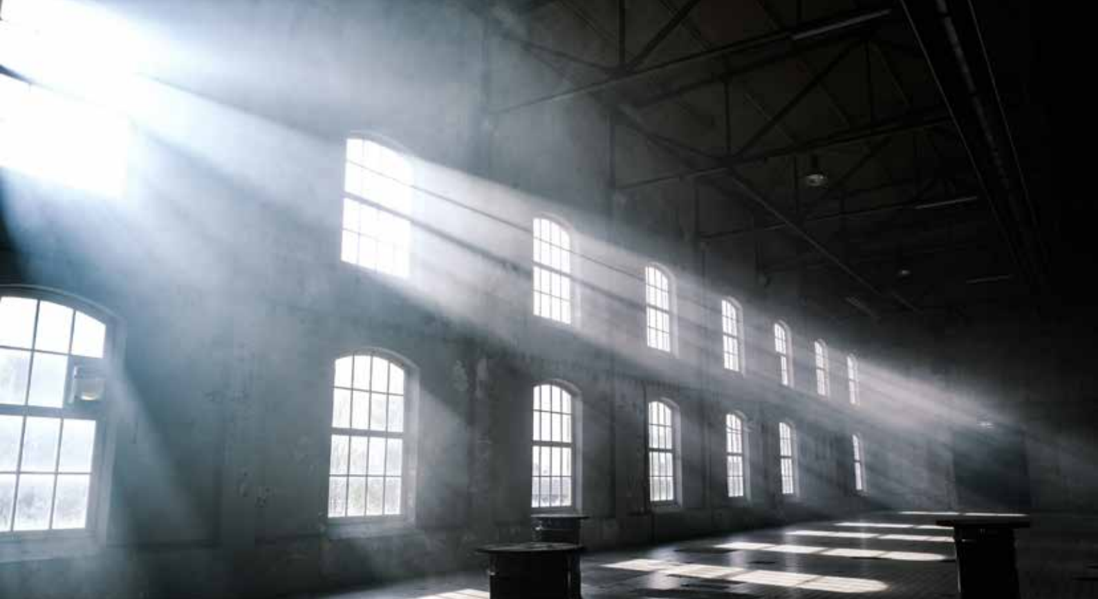
Poussière éclairée par un rayon de soleil.