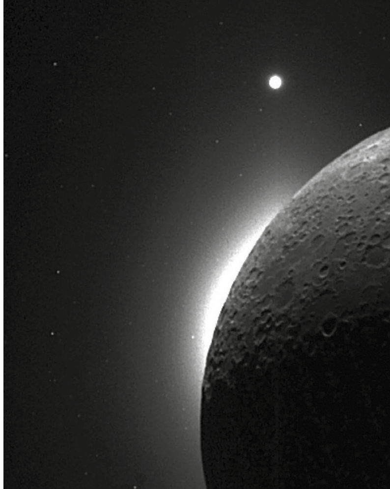
Lorsque la mission Apollo s'est mise en orbite autour de la face cachée de la Lune, les astronautes ont vu un arc de lumière incroyablement brillant à l'horizon juste après le coucher du Soleil. Le point lumineux en haut est la planète Vénus.

De plus, la poussière lunaire n'est pas tassée, comme cela se passe sur la Terre. Toute activité à la surface peut en soulever des seaux pleins, même sans que des astronautes ne marchent à la surface ou qu'un module lunaire ne pose ses pieds sur le sol, on a vu des particules et des nuages de poussière flotter à plusieurs centimètres, voire à plusieurs mètres, au-dessus de la surface. Et ce, malgré l'absence de vent ou d'eau à la surface pour les soulever ! De minuscules particules peuvent même être transportées sur de grandes distances sur la Lune. Les scientifiques attribuent la mobilisation de la poussière à des forces électrostatiques. Des phénomènes similaires pourraient se produire sur d'autres corps dépourvus d'air, tels que les comètes et les astéroïdes.