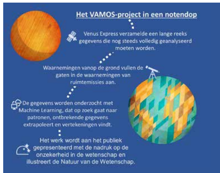
De verschillende stappen van het VAMOS-project waarbij teams van vier Belgische instellingen betrokken zijn (aangepast van © Europlanet Society).

ML heeft recent veel aandacht gekregen van het grote publiek door de introductie van generatieve grote taalmodellen (bijv. Chat-GPT) of tools voor het genereren van beelden (bijv. Dall-E). Het werd echter al gebruikt achter vele aspecten van ons dage-