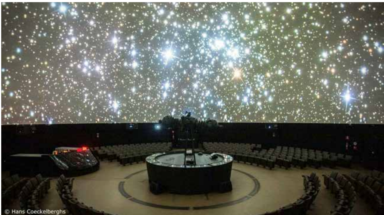
Het Planetarium van Brussel

Opnieuw dient het VAMOS-project als een uitstekend platform om de groei in wetenschappeneducatie en wetenschapscommunicatie te bevorderen. Bijzonder fascinerend is het concept van de Natuur van de Wetenschap ('Nature of Science' of 'NoS'), dat zich richt op de basisregels die wetenschappelijke evolutie, bevindingen en ideologieën sturen. Dit begrip gaat verder dan het presenteren van wetenschap in klaslokalen als een star geheel van kennis. In plaats daarvan stimuleert het discussies over wetenschappelijke benaderingen, gedeelde waarden en tradities, en beperkingen.