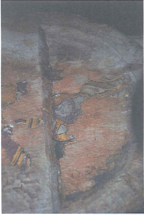
Afb. 2 Triomfkruis (detail: Sint-Servaas), ca. 1250. Oplinter, Sint-Genovevakerk.