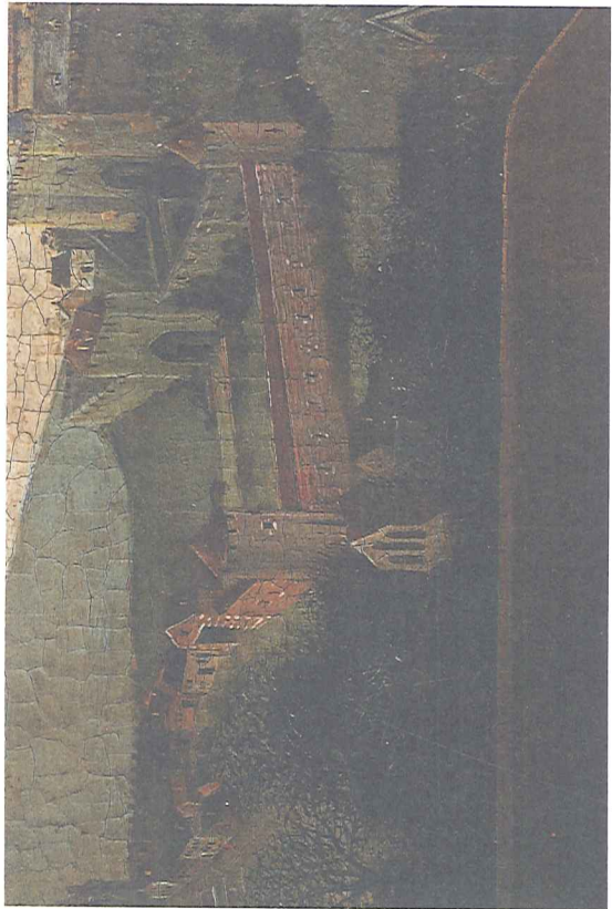
Afb. 4 Meester van Flémalle, Geboorte van Christus (detail: vergezicht op Hoei), ca. 1420. Dijon, Musée des Beaux-Arts.

kruissherenkerk had mogelijk een longitudinale opbouw, zonder transeptarmen.