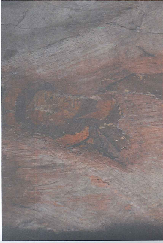
Afb. 3 Triomfkruis (detail: Mozes?), ca. 1250. Oplinter, Sint-Genovevakerk.