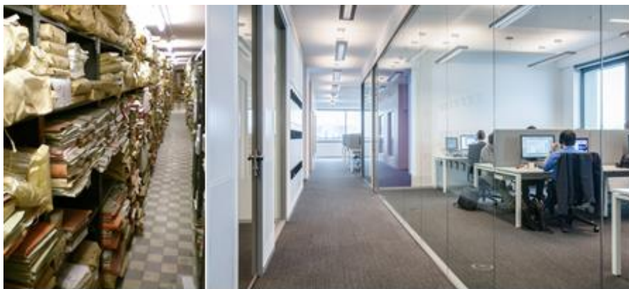
Papierarchiv versus Papierloses Büro

Die Statistiken über diese Weiterbildungen sprechen für sich: Zwischen 2010 und 2015 haben 3560 Beamte an unterschiedlichen Kursen teilgenommen.