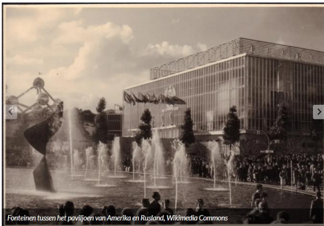
Fontein tussn het paviljoen van Amerika en Rusland

In april 1958 opende in Brussel de wereldtentoonstelling, algemeen gekend als Expo 58. De expo paste in het enthousiaste vooruitgangsgeloof van de naoorlogse periode. Bijna veertig landen pakten uit met hun nationale trots, bedrijven lanceerden nieuwe smaken (waaronder de Côte d'Or Dessert 58!) en architecten toonden hun technisch vernuft. Liefst 41 miljoen mensen bezochten de expo. Temidden van die wervelende activiteiten konden bezoekers ook een stand bezoeken over... de Belgische gevangenis.