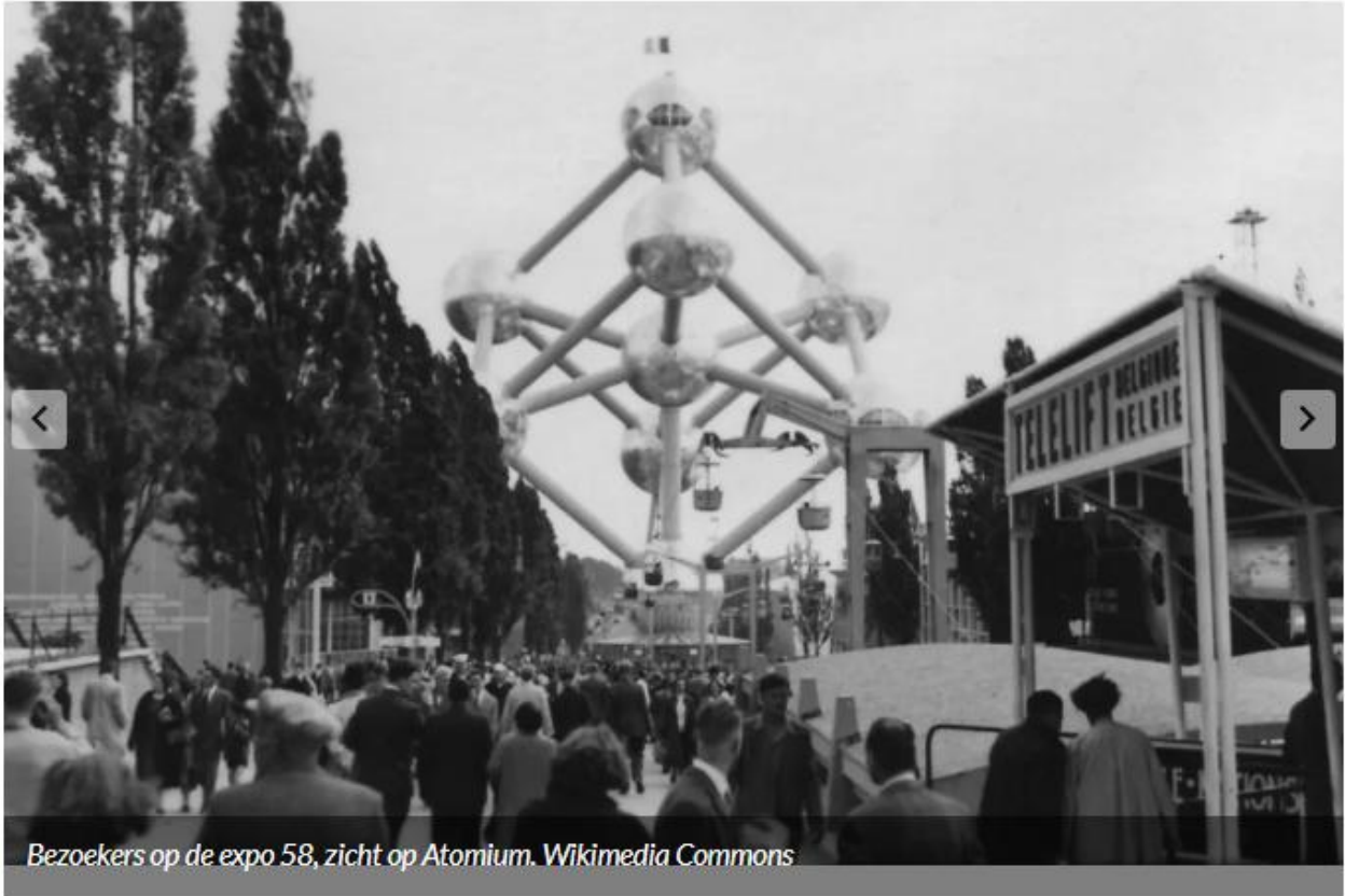
Bezoekers op de expo 58, zicht op Atomium.