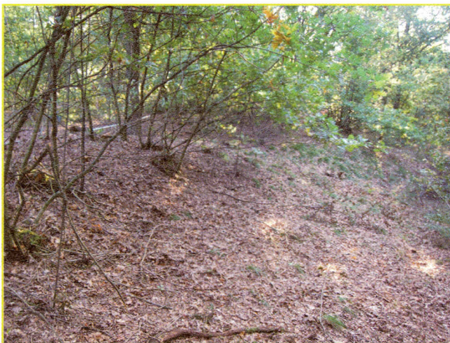
Figuur 5: Gehakte en terug uitgelopen stobben, voor de tweede hakbeurt.