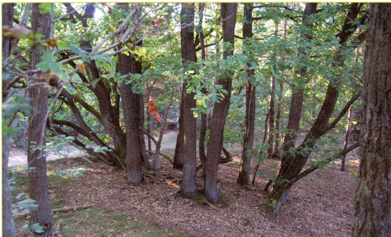
Figuur 3: Oude wintereikstoof op Kruisberg: de stammen staan in een ovaal.