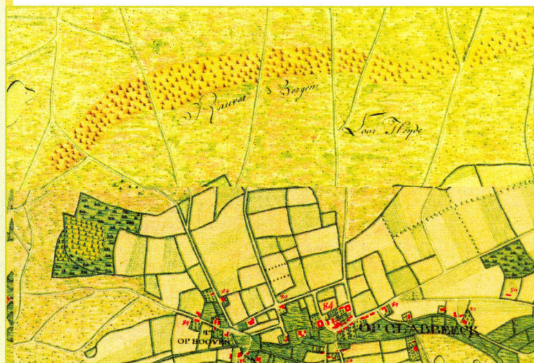
Figuur 1: Landduinen ten noorden van Opglabbeek ten tijde van Ferraris (1771-1778).