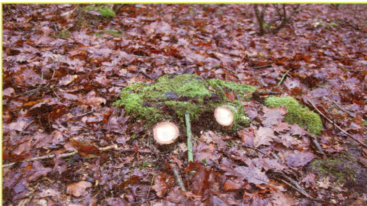
Figuur 6: Na tweede hakbeurt

rondom het perceel. Twee jaar later zaaide men, eveneens bij wijze van proef, lokaal geoogste eikels uit rondom het gekapte perceel (eind 2003). De individuele eikels werden 3 cm onder de grond gestoken. Ondertussen zijn we 10 jaar verder. De opslag van berk, sporkenhout en andere 'niet-eiken' werd onlangs weggenomen zodat enkel nog zaailingen en uitgelopen stobben van eik overblijven. Na wat meet- en rekenwerk weten we nu dat één vierde van de