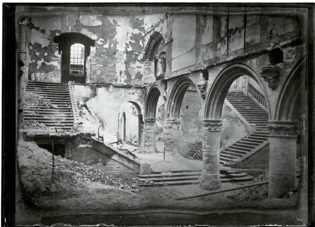
Vue intérieure de la Bibliothèque universitaire de Louvain après son incendie par les Allemands en 1914 [extraite du recueil Louvain en ruines ]. - R-2009-17004

Le fonds photographique comprend également des sources pour aborder de nouveaux objets de recherche en histoire contemporaine, comme l'étude des voyages et du tourisme. En lien avec ces thématiques, le Cabinet des Estampes possède environ 500 photographies de châteaux belges (5) datant de la seconde moitié du XIX e siècle, des vues de la côte belge vers 1900 ainsi que des ensembles de clichés pris dans le monde entier : Angleterre, Congo, Canada, Égypte, États-Unis, France, Grèce, Inde, Italie, Maroc, Pays-Bas, Suisse ou encore Turquie.