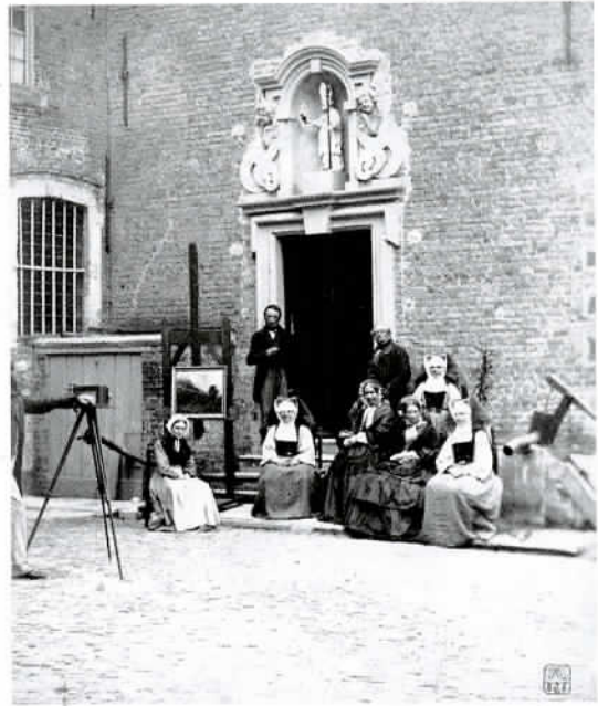
Extérieur et intérieur du Musée de l'hospice Saint-Jean à Bruges - 1859. - S.III 101786

La diversité du fonds photographique permet également d'aborder certains aspects de l'histoire sociale. En effet, plusieurs clichés concernent le patrimoine immatériel de la Belgique (principalement Bruxelles et Anvers) : des processions religieuses (la Fête-Dieu de 1882 à Saint-Josse-ten-Noode), des kermesses, des cérémonies et fêtes diverses (le Cortège du Landjuweel d'Anvers en 1882). Certains métiers, aujourd'hui tombés en désuétude, y sont aussi représentés : par exemple, dans un album datant de la fin du XIX e siècle composé de laitières flamandes. Par ailleurs, de nombreux portraits, encore non identifiés pour le moment, réalisés par des photographes professionnels (7) sont conservés sous forme d'albums. Ceux-ci donnent un aperçu des élites de la société de leur époque. Quelques portraits sous forme de daguerréotypes et ambrotypes remontent aux débuts de la technique photographique.