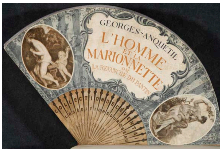
7. Georges-Anquetil, L'Homme et la marionnette, ou la revanche du pantin , Paris, 1930.

Les formats inhabituels sont conservés aux Imprimés anciens et précieux en raison de leurs techniques particulières, à commencer par les livres minuscules, anciens et modernes, rangés à part pour des raisons de conservation. Un livre de Georges Anquetil, L'Homme et la marionnette, ou la revanche du pantin , Paris, 1930, est conçu par l'auteur pendant un séjour en prison ; paru dans la collection L'Éventail, il est imprimé,