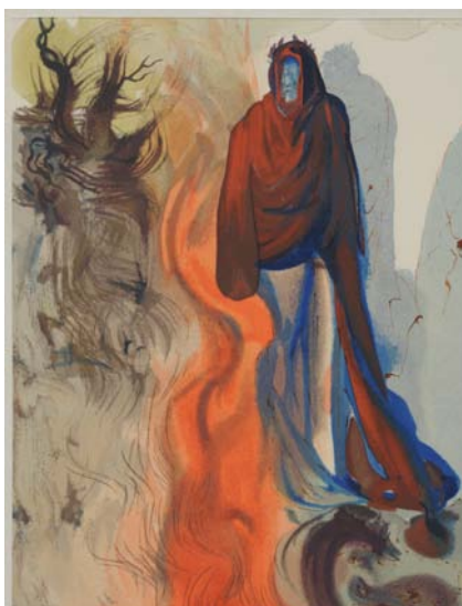
6. Dante, La Divine Comédie , Paris, Joseph Foret, 1960-1963, illustrations sur bois de Dali.

différents états, parfois de cuivres rayés. Et puis, la typographie elle-même détruit les frontières de la page, comme en témoignent les Calligrammes d'Apollinaire. Une partie de la collection Solvay est constituée de manuscrits et tapuscrits littéraires, de jeux d'épreuves, comportant des corrections de l'auteur, dont La Condition humaine et L'Espoir de Malraux, et il faut venir à Bruxelles pour en étudier la substance. Ceux de Jean Cocteau sont souvent rehaussés de quelques dessins originaux, tant il est vrai qu'il dessinait en écrivant ou écrivait en dessinant, d'une seule main. Et il est d'autres originaux, par