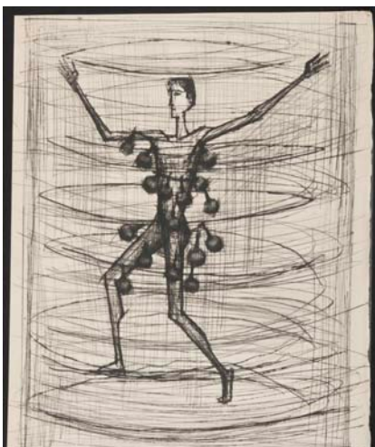
5. Cyrano de Bergerac, Voyages fantastiques aux États et Empires de la Lune et du Soleil , illustrations de Bernard Buffet, Paris, 1958.