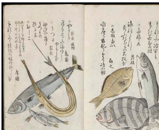
3. Umi no sachi [Les bienfaits de la mer], Edo, 1762, anthologie de haiku .

un aspect international aux collections, telles la donation Comte de Launoit, constituée d'éditions et de manuscrits voltairiens du XVIIIe siècle, ou la bibliothèque Hans de Winiwarter, un chirurgien et collectionneur belge, réunissant plus de mille livres japonais du XVIIe au XIXe siècle, apportant un autre regard, comparatif, sur les arts du livre (ill. 3). Les publications du Québec (Gouvernement, Université de Montréal, Archives et Bibliothèque) sont de type officiel ou académique et sont conservées aux Imprimés contemporains parmi les ouvrages de référence. Il en est de même pour celles du Canada.