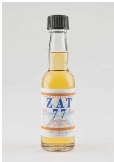
9. Henri Vernes, Le Lagon aux requins, une aventure de Bob Morane , Hélécine, Nautilus, 2000, livre-objet dans une caisse contenant une bouteille de whisky Zat 77.

Et puis le livre est désormais conçu comme un tout par un artiste et devient livre-objet, aux structures éclatées. La section du Dépôt légal transmet d'ailleurs chaque année aux Imprimés anciens et précieux les publications ou objets édités à petit nombre d'exemplaires, les éditions bibliophiliques, les livres illustrés par des artistes belges ou conçus par eux, le résultat étant d'avoir pratiquement toute leur production dans les collections de la Bibliothèque royale. De Twaalf jaargetijden van Banana (Les douze saisons de Banana), Anvers, Banana Press, 1972, de Walter Paul Jan Beckers, en est un exemple. Il s'agit d'un ensemble de douze poèmes érotiques tirés à 50 exemplaires, en feuilles dans un boîtier en plexiglas, à compartiment soigneusement scellé rempli d'eau dans laquelle flotte une banane en plastique, qui dispense l'éditeur de toute illustration, et transparente allusion à la maison d'édition. Plus simplement, un livre-objet que les bibliothécaires et conservateurs nomment familièrement entre eux la « banane dans le formol ». De l'artiste anversois Chris Ferket, la Réserve possède des poèmes édités à