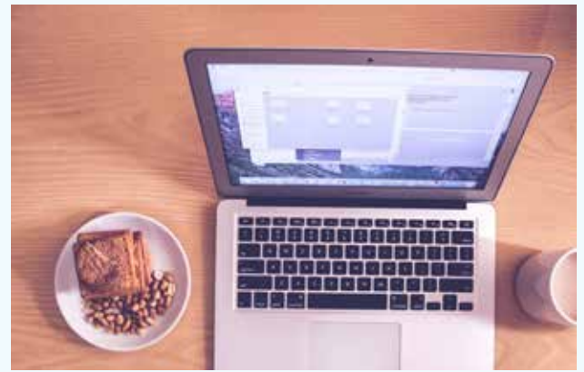
Eén van de redenen waarom consortia worden opgericht is het financiële voordeel