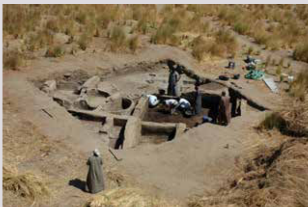
Dans la tranchée de sondage 3, de nombreux vestiges de bâtiments en briques crues, en bon état de conservation, ont été retrouvés.

La déesse principale d'Elkab, Nekhbet, à l'apparence de vautour, était aussi la plus importante de Haute-Égypte. Elle assurait en outre la protection du pharaon avec la déesse cobra Ouadjet. Des cimetières de l'élite et des inscriptions hiéroglyphiques, qui attestent de la présence d'une importante classe de prêtres, et nombre d'autres vestiges archéologiques, comme un grand complexe de stockage et de traitement du grain, datent tous de la période protodynastique (vers 3000-2700 av. J.-C.) et de l'Ancien Empire. Ils témoignent indéniablement du rayonnement d'Elkab dès les prémices de la civilisation pharaonique. La recherche archéologique s'est surtout concentrée par le passé sur les grands monuments religieux et funéraires du site. L'habitat originel et ses occupants n'ont suscité que peu d'intérêt. L'emplacement, l'étendue et l'organisation de l'habitat étaient donc très mal connus.