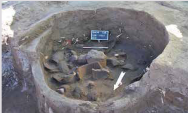
Dans ce silo circulaire, certainement utilisé au départ pour stocker le grain, une grande quantité de céramique a été retrouvée. Un matériel archéologique comme celui-ci nous apprend énormément sur la vie quotidienne à Elkab à l'Ancien Empire.