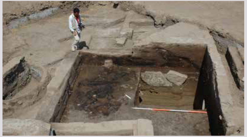
Pour consolider les fondations du bâtiment de la 2 e dynastie, de grandes plaques de pierre ont été placées. Les poutres en bois brûlées bien préservées au centre de la photo proviennent très probablement de l'effondrement du toit.