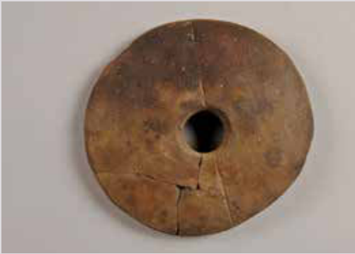
Le Clayton Disk ('disque de Clayton') retrouvé au niveau de sol le plus ancien du bâtiment de la 2 e dynastie, une trouvaille particulièrement rare dans la vallée du Nil.