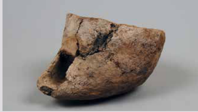
Un creuset entièrement intact pour la production du cuivre. Il date d'il y a environ 5000 ans et constitue le plus ancien exemplaire complet de ce type au monde !