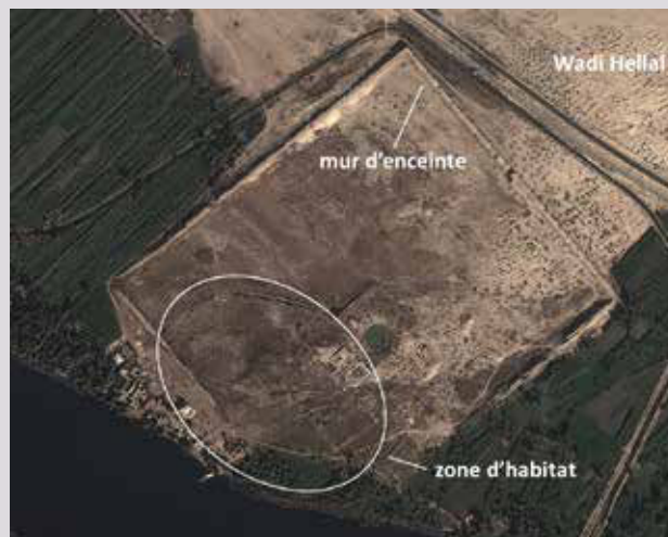
La zone d'habitat d'Elkab à l'intérieur de l'enceinte monumentale du IV e siècle av. J.-C..

Dans un précédent numéro de Science Connection (n° 37, 2012, p.3-7), nous avons déjà évoqué le dégagement à Elkab, en 2009, des vestiges d'une ville de l'Ancien Empire (vers 2700-2100 av. J.-C.). Plusieurs missions de fouille entreprises depuis 2012 ont permis de faire d'autres découvertes et constatations d'importance qui ont accru la documentation et la compréhension de l'évolution de l'habitat sur ce site archéologique. Elles engendrent en outre de nouvelles pistes intéressantes sur l'origine de l'urbanisation en Égypte ancienne, un sujet qui, jusqu'à ce jour, avait peu attiré l'attention des archéologues et des égyptologues.