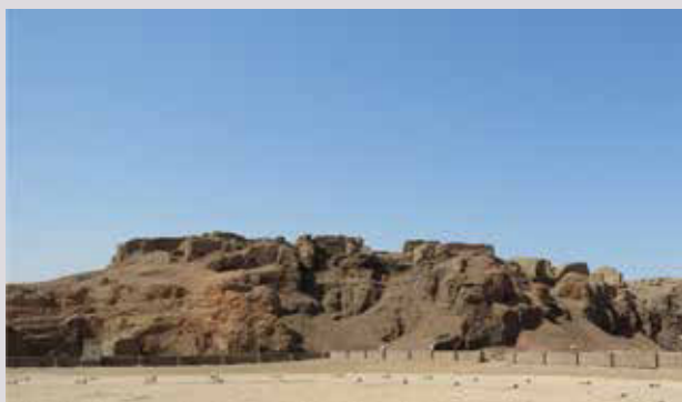
Vue du tell d'Edfou, un important site un peu au sud d'Elkab. Un tell d'habitat similaire a dû exister également à Elkab, mais il a été en grande partie démantelé au cours du XIX e siècle.