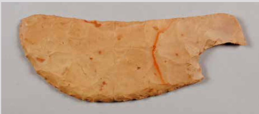
Outre la céramique, de nombreux outils en pierre ont également été retrouvés. Ce beau couteau en silex remonte au Protodynastique (vers 2800-2700 av. J.-C.).