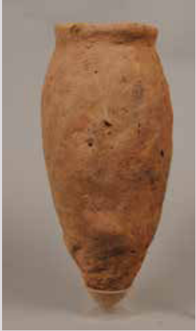
Un exemple d'une jarre à bière intacte du début de l'Ancien Empire (vers 2600 av. J.-C.). Ce type de récipient a été retrouvé en grande quantité à Elkab.