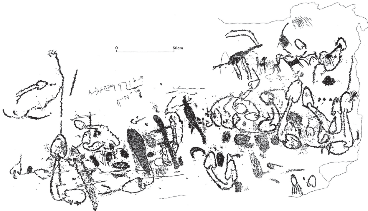
Fig. 3. Un panneau rupestre complexe de Gebelet Youssef à el-Hosh. Les représentations d'animaux en haut à droite sont de date plus récente que le reste du panneau ; elles remontent à l'époque prédynastique (4 e millénaire avant notre ère). Les motifs plus anciens curvilignes en forme de « champignon » sont interprétés comme des pièges à poissons labyrinthiques dessinés en plan.

la majeure partie des gravures rupestres de la région d'el-Hosh date de l'époque prédynastique (4 e millénaire avant notre ère) et de la période protodynastique (vers 3100-2650 avant notre ère). Néanmoins, de nombreuses superpositions de motifs (principalement par des représentations de girafes prédynastiques) et des variations dans la patine et dans l'érosion indiquent sans conteste que les gravures curvilignes ainsi que celles en forme de « champignon » sont chronologiquement plus anciennes. Ces motifs apparaissent parfois isolés ou en petits groupes, mais sont fréquemment intégrés dans de vastes panneaux, composés en outre de divers tracés abstraits ou figuratifs tels des cercles, des échelles graduées, des figures humaines schématiques, des empreintes de pied ou encore des crocodiles stylisés. Trois grandes collines de grès le long du Nil, dénommées du nord au sud Gebelet Youssef, Abou Tanqoura Bahari et Abou Tanqoura Qibli, présentent ce type particulier de gravures.