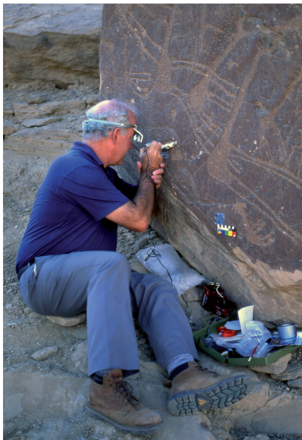
Fig. 4. Le spécialiste australien des vernis rocheux Alan Watchman échantillonne des dessins rupestres à Gebelet Youssef en 1998. Les motifs curvilignes sont ici recouverts par de belles représentations prédynastiques de girafes.

Mais pourquoi ces chasseurs-cueilleurs ont-ils ressenti le besoin de représenter leurs nasses à poissons ? La réponse à cette question n'est pas simple. Il est à noter que l'apparition de ces motifs de nasses semble presque exclusivement limitée à la région d'el-Hosh. Peut-on donc en conclure que le territoire d'el-Hosh était particulièrement bien adapté à la pratique de cette technique de pêche ? Peut-être divers groupes humains alliés ou apparentés se réunissaient-ils là annuellement pendant la saison de la crue du Nil, de juillet à octobre, pour mener une pêche commune, une activité en marge de laquelle avaient lieu d'éventuelles activités rituelles ou cérémonies, parmi lesquelles peut-être la réalisation de gravures rupestres ? Les ethnographes attestent l'existence de ce type de rassemblement en divers endroits de la planète, notamment en Australie, rassemblements qui se caractérisent par l'exploitation