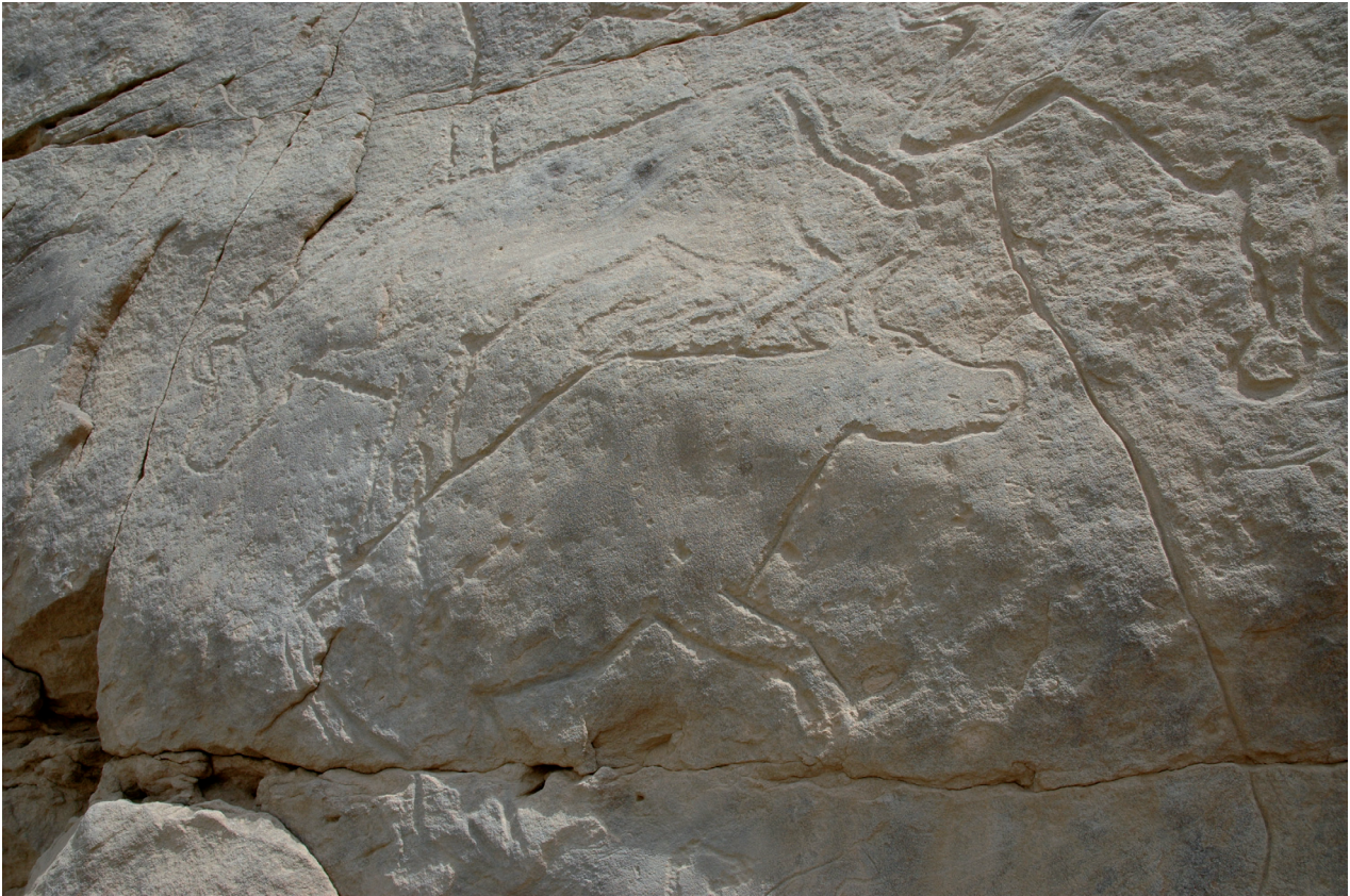
Fig. 11. Ce détail du panneau le plus important de Qurta I montre la manière dont les auteurs de l'art rupestre ont fait usage du relief de la paroi pour donner une dynamique aux dessins.

directions possibles, et il n'est pas rare que la tête d'un animal soit dirigée vers le haut ou vers le bas. Par ailleurs, on observe régulièrement une grande dynamique dans la manière dont les animaux sont réalisés : le dos est cambré et les pattes sont pliées ou fléchies, comme si les animaux étaient en mouvement. Certains bovidés paraissent avoir été gravés comme s'ils étaient en train de se rouler dans la poussière ou la boue ; d'autres sont peut-être figurés morts, ce qui pourrait expliquer les positions non naturelles que présentent leurs pattes. À cet égard aussi, cet art rupestre se distingue nettement des figurations prédynastiques.