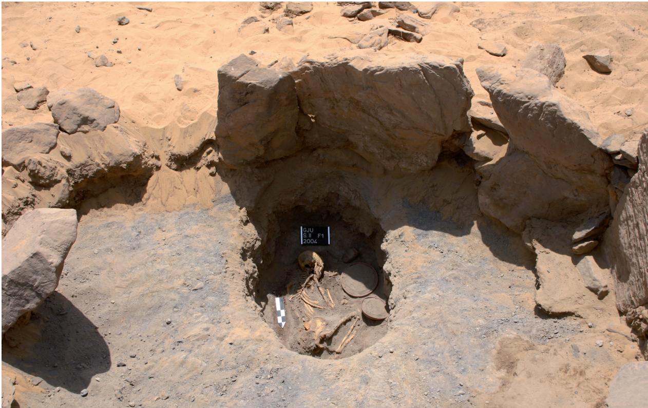
Fig. 5. Une tombe intacte de l'époque prédynastique, plus précisément de la phase Nagada II, a été retrouvée par hasard en 2004 durant les fouilles menées à el-Hosh. Elle peut être datée vers 3500-3400 avant notre ère.

Néanmoins, le site de Gebelet Youssef réservait encore quelques surprises. Ainsi, à l'extrémité méridionale de la colline, plusieurs constructions circulaires, aux parois constituées d'un amoncellement rudimentaire de pierres, avaient été observées. Les céramiques grossières mises au jour dans ce secteur tendent à démontrer que ces installations de fortune étaient probablement l'œuvre de bédouins. Leur fonction originelle, de même que leur ancienneté, restent inconnues mais l'existence de sols en terre battue et d'importantes quantités de paille suggèrent qu'à une époque plus récente, ces structures ont pu être utilisées comme étables. Au plus grand étonnement des archéologues, une sépulture intacte, profondément creusée dans la roche, fut repérée sous l'une de ces structures. La sépulture date à l'évidence