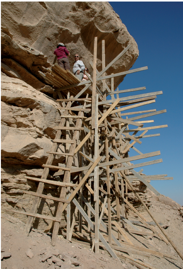
Fig. 13. Pour atteindre les dessins rupestres à Qurta, il a parfois été nécessaire d'installer d'impressionnants échafaudages en bois.

À Qurta, la mission belge a cependant été particulièrement chanceuse. Sur un des trois sites concernés, Qurta II,