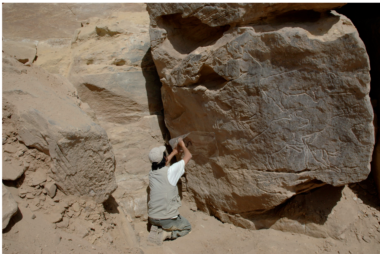
Fig. 14. Les fouilles à Qurta II en 2009 ont amené la découverte de dessins rupestres entièrement enfouis. Leur âge paléolithique tardif (plus de 15.000 ans) a pu être montré grâce à la technique de datation par OSL.