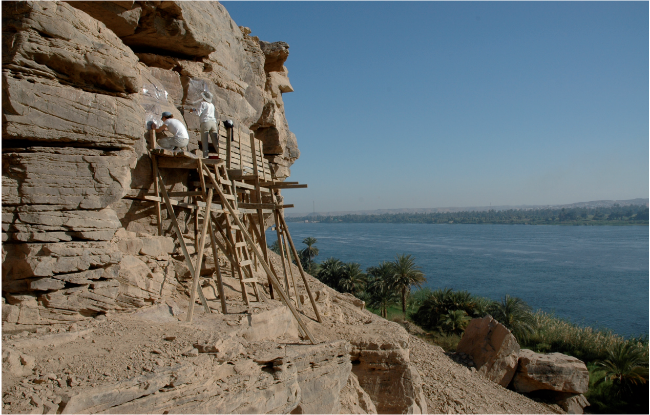
Fig. 7. Un site d'art rupestre exceptionnel a été découvert en 2004 à l'extrémité sud de la colline rocheuse d'Abou Tanqoura Bahari, présentant plusieurs représentations de boeufs sauvages ou d'aurochs. Ce n'est qu'en 2010, lorsque cette photo a été réalisée, que les dessins ont pu être étudiés en détail.

érosion qui affectaient ces nouvelles figurations rupestres gravées soulignaient leur grande ancienneté.