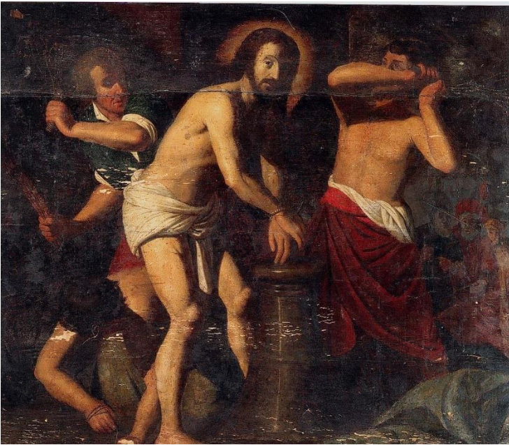
Fig.4 François Walschartz, Flagellation du Christ , bois, 88 x 105 cm, Liège, Musée des Beaux-Arts.