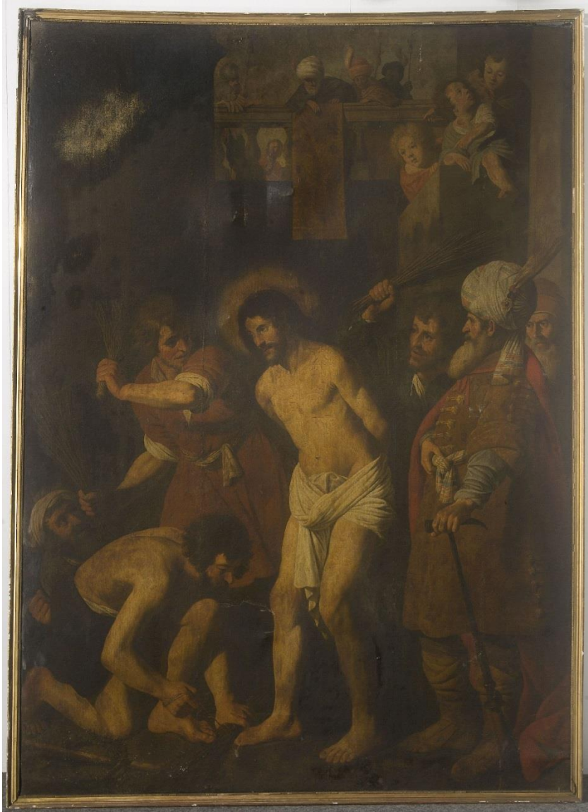
Fig.2 Idem , cliché de 2009.