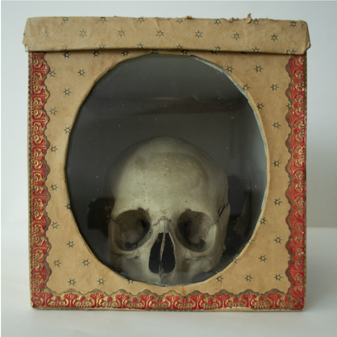
Schedelrelik van Sint-Ursula. Huidige bewaarplaats onbekend. Voorheen Kerniel, Abdij Mariënlof.

zuster Maximilienne in de negentiende eeuw naar Kerniel trok om een nieuwe cisterciënzergemeenschap op te richten. 96 Op het papiertje bij de schedel wordt aangegeven dat er oorspronkelijk twee schedels waren. Van Lieshout meldde dat hij in 1935 er twee in de abdij zag. 97 Deze tweede schedel is mogelijk nadien in stukken gebroken en gebruikt om een besloten hofje te versieren. 98