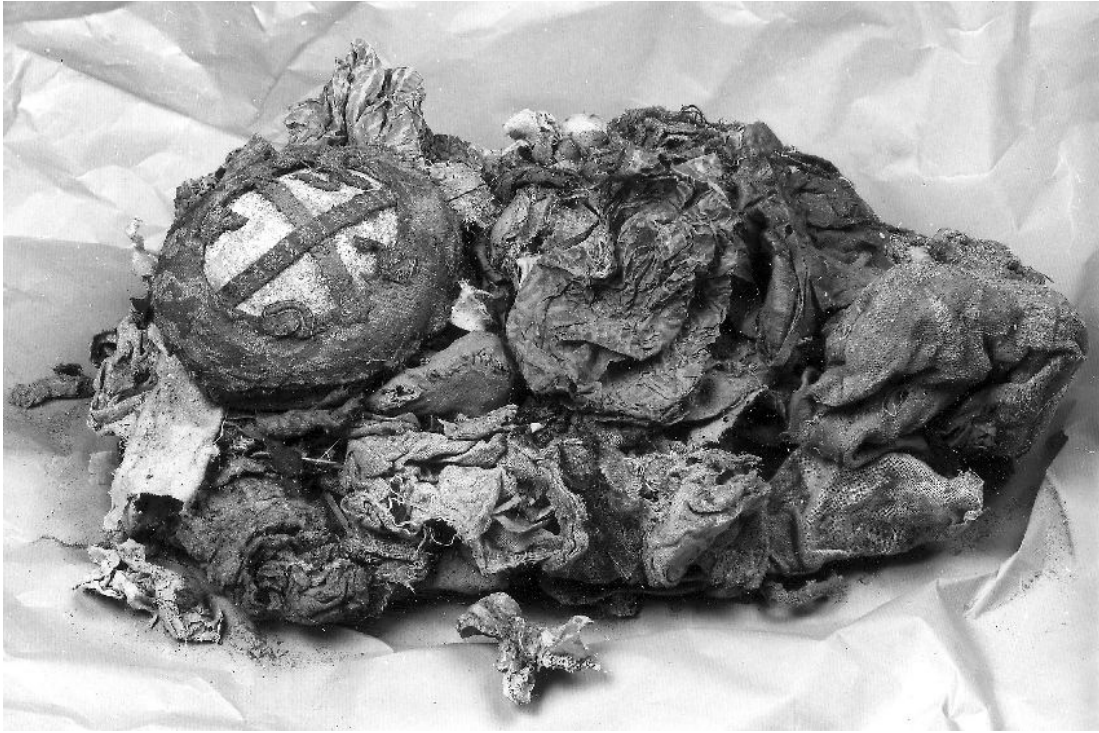
Relieken van de elfduizend maagden teruggevonden op de dekenijzolder van de Onze-Lieve-Vrouwekerk in Sint-Truiden. Foto vóór de conservatiebehandeling.