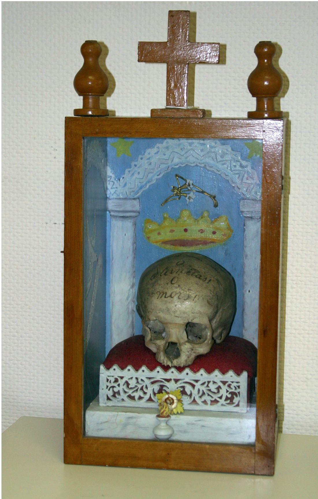
Schedelrelik van de heilige Predelina, maagd uit de groep van Sint-Ursula en de elfduizend maagden. Reliek afkomstig van het clarissenklooster in Sint-Truiden. Sint-Truiden, Museum DE MINDERE, inv. nr. MVM/CL-ST/R1186.