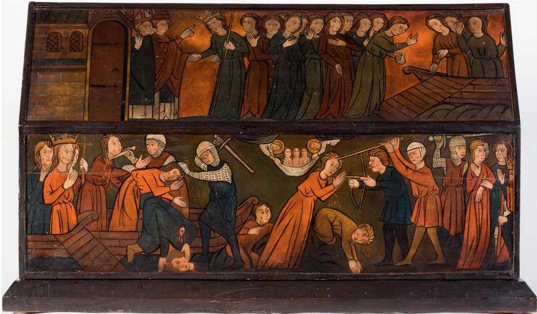
Koos Van der Horst junior, Reliekschrijn van Sint-Odilia , 1951. Maaseik, Kruissherenklooster. © KIK-IRPA, Brussel

aantal conclusies over de relieken op. Met uitzondering van het sleutelbeen is het duidelijk dat de beenderen van een volwassen persoon zijn. Vervolgens geeft de morfologie aan dat er niet van één maar van (minstens) twee verschillende lichamen beenderen in de kist liggen. Het sleutelbeen wordt toegeschreven aan een jonge persoon tussen 18 en 25 jaar, terwijl de beenderen met osteoartrose eerder wijzen in de richting van een lichaam van oudere leeftijd. 129 Een bijkomende radiokoolstofdatering bepaalt dat de relieken tussen minimaal 80 en maximaal 400 na Christus zijn te dateren. Het sleutelbeen (nr. 7) dat eerder is aangeduid als het bot van een jong individu, kan met 95,4% zekerheid tussen 40 voor Christus en 130 na Christus worden gedateerd. In vergelijking met de andere acht beenderen en omwille van zijn datering is het dus uitgesloten dat dit been tot hetzelfde individu toebehoort.