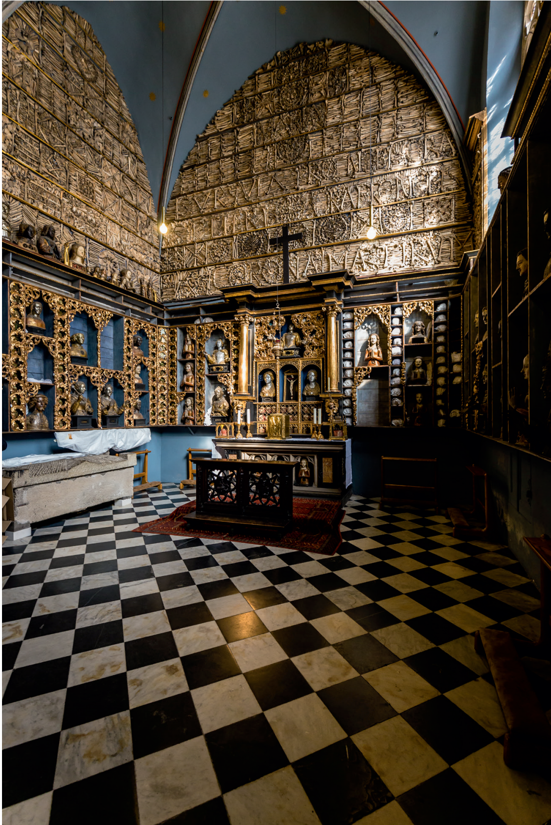
Goldene Kammer met relikven van Sint-Ursula en de elfduizend maagden. Keulen, Sint-Ursulakerk.