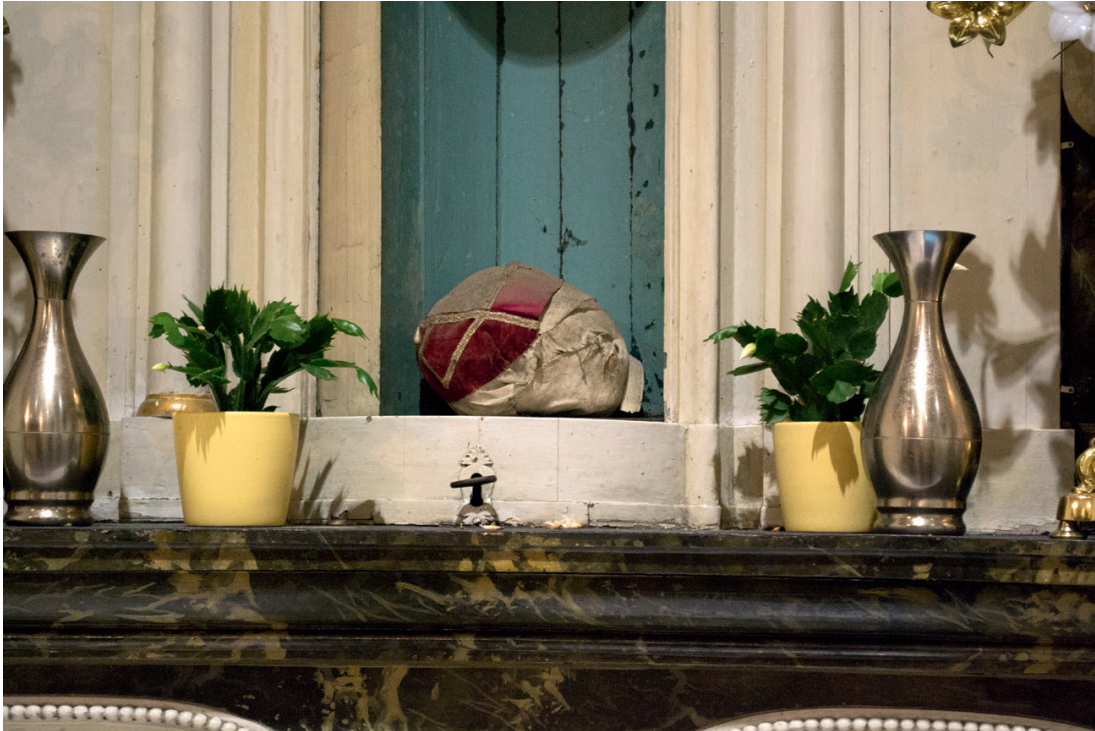
Schedelrelik teruggevonden in het Maria-altaar. Kerniel, Sint-Pantaleonkerk.

heilighe maeghden.” De schedel heeft vervolgens een conservatiebehandeling ondergaan en er is een wetenschappelijke studie uitgevoerd. 99 Met behulp van de radiokoolstofdateringsmethode zijn de verschillende lagen textiel over de schedel gedateerd. Het rode damast en het witte linnen wijzen uit dat ze in dezelfde periode om de schedel zijn aangebracht, namelijk ergens tussen ca. 1450 en ca. 1640. 100 Dit is bijzonder laat in vergelijking met de eerder onderzochte schedelreliken in Sint-Truiden, Tongeren en Hasselt. De datering van het rode zijdefluweel is verschillend van het rode damast en witte linnen. Het is jonger en dateert van ca. 1680 tot ca. 1930. Zowel het witte linnen, het rode damast als het rode zijdefluweel moeten oorspronkelijk tijdens dezelfde periode om de schedel zijn aangebracht. Het is niet ondenkbaar dat het fluweel aan de schedelrelik ook eerst van diezelfde periode dateerde, maar dat het doorheen de tijd versleten of beschadigd was geraakt en door een nieuwe werd vervangen.