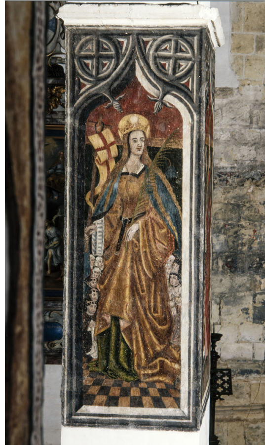
Anonieme schilder, Sint-Odilia , einde 16de eeuw. Sint-Truiden, Begijnhofkerk.

gesticht. 44 In het interieur van de begijnhofkerk zijn enkele dertiende-eeuwse en een groot aantal zestiende-eeuwse muurschilderingen bewaard. Verschillende vrouwelijke heiligen zijn op de pijlers in het schip afgebeeld, waaronder de heilige Ursula. 45 Ze houdt een pijl in haar rechterhand, het typische attribuut om deze heilige te herkennen. In haar opengeslagen mantel vinden enkele personen bescherming. In tegenstelling tot de andere schilderingen, die van de vroege zestiende eeuw dateren, zijn de voorstellingen op deze pijler jonger. Ze zijn aan het einde van de zestiende eeuw toegevoegd en zijn waarschijnlijk over bestaande afbeeldingen aangebracht. Een vernieuwing van deze voorstelling en de positie dicht bij het hoofdaltaar geven blijk van een belangrijke appreciatie van de begijnen voor deze heilige. Volgens de kroniek van de Sint-Trudo-abdij moeten er relieken van de elfduizend maagden in 1260 uit Keulen in de abdij