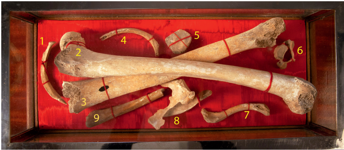
Inhoud van het Sint-Odiliaschrijn. Maaseik, Kruissherenklooster.