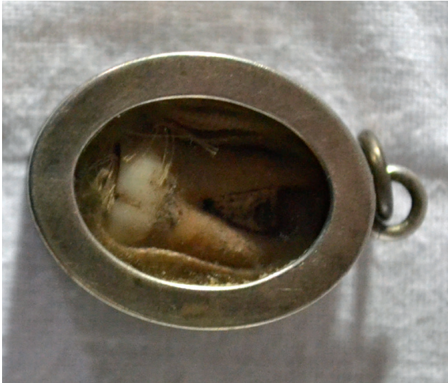
Tandreliet van Sint-Odilia. Borgloon, Sint-Odulphuskerk.