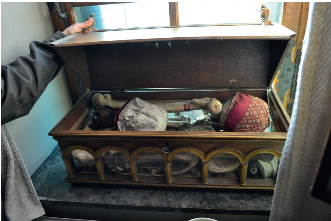
Reliekschrijn met beenderen en middeleeuws textiel. Borgloon, Sint-Odulphuskerk.

In de Borgloonse Sint-Odulphuskerk wordt een reliekschrijn bewaard, gevuld met allerlei beenderen, middeleeuws textiel en twee schedelreliken. De enige bestaande beschrijving van de inhoud dateert van 1935. 103 Tegenwoordig ontbreken daar een middeleeuws reliekschrijn, een middeleeuwse tekst op perkament en een derde schedelrelik. De derde schedel kan in de Sint-Pantaleonkerk van Kerniel worden gevonden (zie eerder). Het textiel rond de schedel in Kerniel lijkt sterk op dat van één schedel in het Borgloonse reliekschrijn. Het materiaaltechnische onderzoek van beide schedels heeft duidelijke verbanden in datering van het textiel en de verven aangetoond. 104 De schedel van Borgloon dateert van 990 tot 1160 (95,4% waarschijnlijkheid). Het witte linnen errond is jonger dan de schedel en moet ergens tussen 1490 en 1670 zijn aangemaakt (95,4% waarschijnlijkheid). De datering van het textiel over het witte linnen is van dezelfde periode: 1480-1650 (95,4% waarschijnlijkheid).