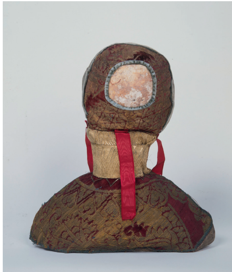
Schedelrelik 1 van de Elfduizend maagden in de Onze-Lieve-Vrouwebasiliek van Tongeren.

Foto vóór de ontmanteling in 1987.