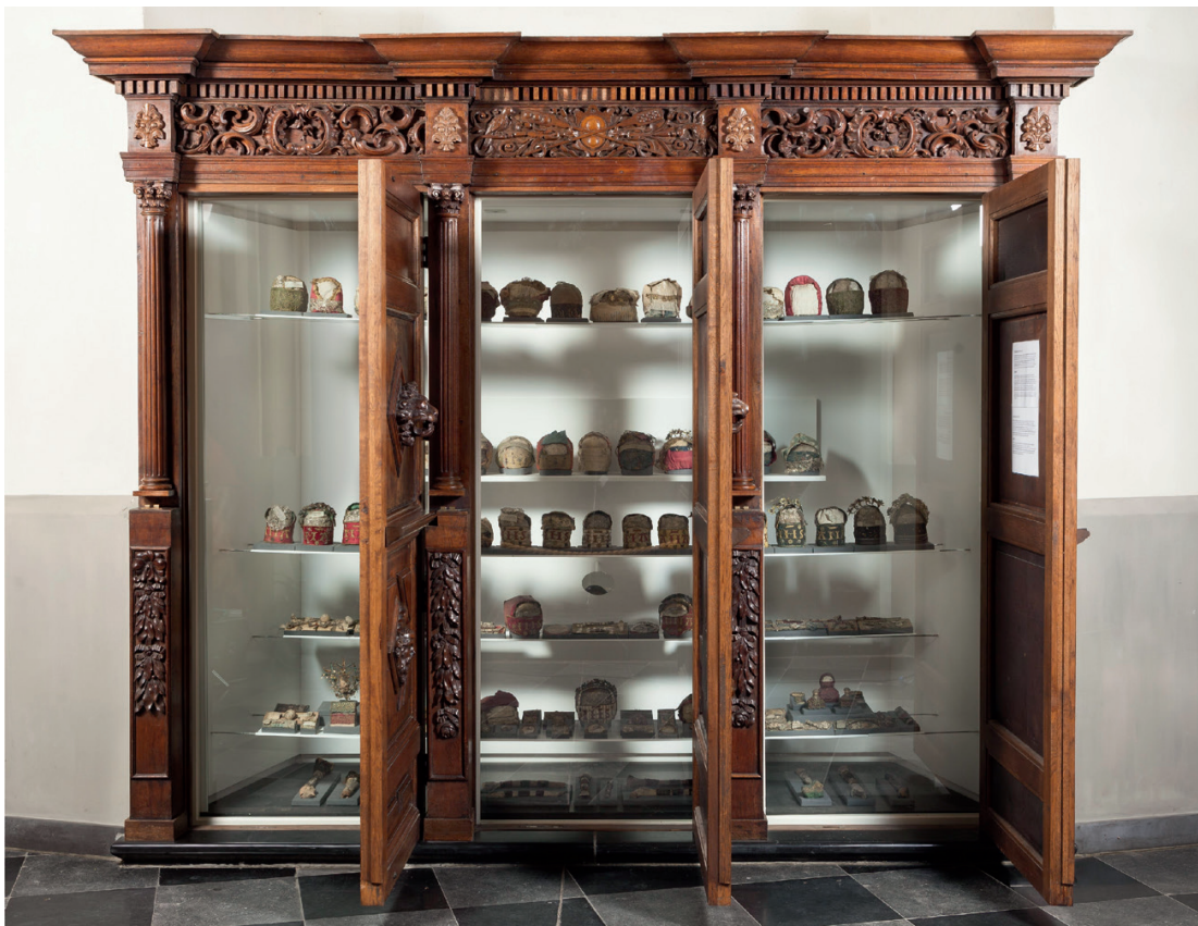
Geklimatiseerde vitrinekast met daarin de schedelreliken van Herkenrode. Hasselt, Sint-Quintinskathedraal.