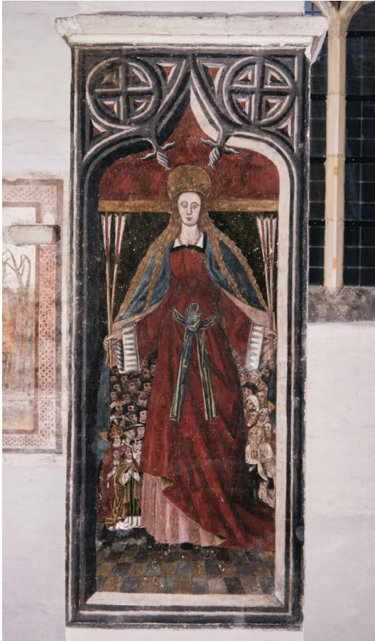
Anonieme schilder, Sint-Ursula , einde zestiende eeuw. Sint-Truiden, Begijnhofkerk.