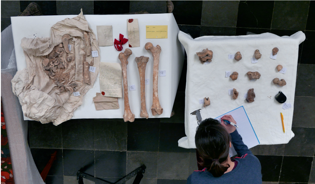
Onderzoek naar de inhoud van het Sint-Odiliaschrijn in maart 2016.

De inhoud van het oude reliekschrijn is in 2016 onderzocht. 120 Deze bestond uit documenten, textiel uit de zeventiende eeuw en verschillende beenderen. Vijfentachtig botten werden door een fysisch-anthropologe geïdentificeerd. Het osteologisch onderzoek toonde aan dat beenderen van verschillende personen en geslachten in het schrijn voorkomen. Het bijkomende radiokoolstofdateringsonderzoek heeft uitgewezen dat de bestudeerde relieken een datering tussen 120 tot 540 aangeven. De bijkomende studie van de stabiele isotopen heeft een groot verschil in waarden kunnen aantonen, wat wijst in de richting van een grote diversiteit tussen de verschillende beenderen. Een homogene groep, familiale band, personen van eenzelfde sociale stand of personen die in dezelfde gemeenschap leefden, lijkt uitgesloten te zijn. De verschillende onderzoeken tezamen wijzen uit dat vijf individuen of meer kunnen worden geïdentificeerd.