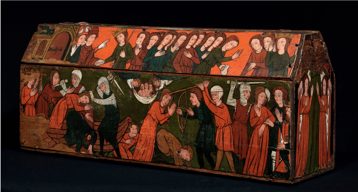
Anonieme schilder, Reliekschrijn van Sint-Odilia , 1292. Borgloon, Sint-Odulphuskerk.

is een bijzonder fragiel stuk en is het oudst gedateerde kunstwerk op paneel van de Benelux. Het schrijn kan dankzij een middeleeuws document met het jaartal 1292 in verband worden gebracht. Sinds 2013 is het opgenomen op de Topstukkenlijst van de Vlaamse Overheid, omdat het schrijn een bijzondere waarde op kunsthistorisch en artistiek vlak heeft en voor de toekomst moet bewaard en beschermd blijven. Bij de sluiting van Abdij Mariënlof is het schrijn geschonken aan het bisdom Hasselt. Zij gaven het op hun beurt voor langdurige bruikleen aan de Sint-Odulphuskerk. 111