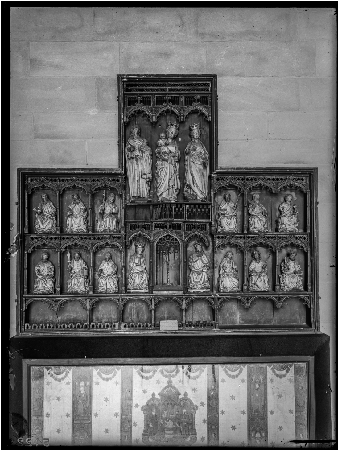
Apostelenretabel, afkomstig van het Sint-Catharinabegijnhof van Tongeren. Brussel, Koninklijke Musea voor Kunst en Geschiedenis, inv. nr. 2957.

( schedula ) in een modern handschrift. Ze geven aan dat er ooit relieken van de elfduizend maagden in de beurzen zaten. 62 Een vierde reliekkeurs heeft een achttiende-eeuwse schedula die meldt dat de ingesloten relieken aan de heilige Ursula worden toegeschreven. 63 Verder is er het reliekschrijn van