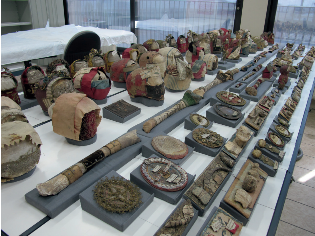
Reliekenschat van Herkenrode in het restauratieatelier van het Koninklijk Instituut voor het Kunstpatrimonium.